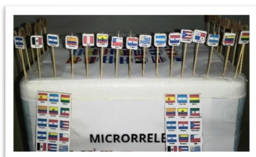
Figura 4 – Dinámica de los grupos