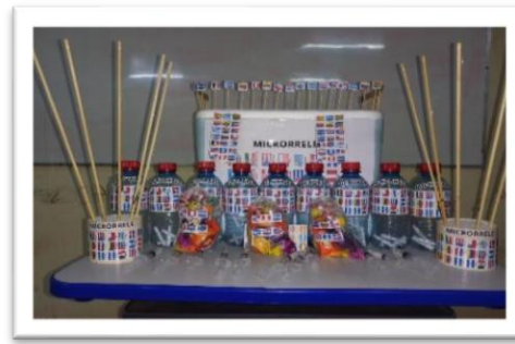
Figura 2 – Bases de círculo, caño PVC, 75mm