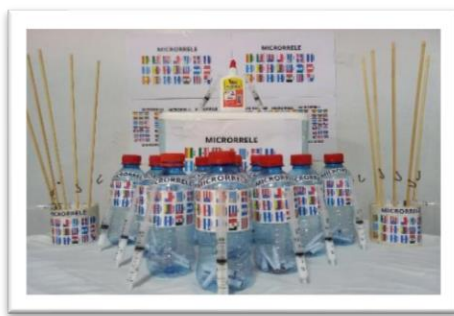
Figura 1 – Caña pequeña de pescar

Fue aplicada a los alumnos del primer año B, mañana, pero que se puede aplicar a los tres niveles de la enseñanza mediana. En la elaboración, de la dinámica confeccionamos diez anzuelos pequeños, atados a una caña pequeña de pescar; hicimos dos bases en forma de círculo, en un caño PVC de 75mm para organizar las cañas de pescar, seleccionamos diez botellas de 300ml transparentes (ver imágenes).