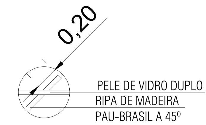
DETALHE 1 - DIVISÓRIA ESC.: 1/20