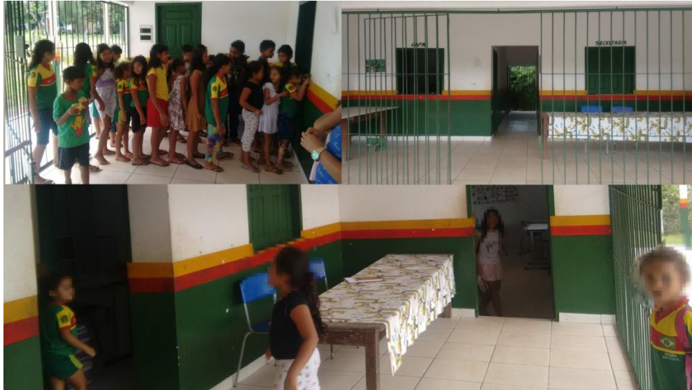
Imagem6 – Área de recreação e refeitório