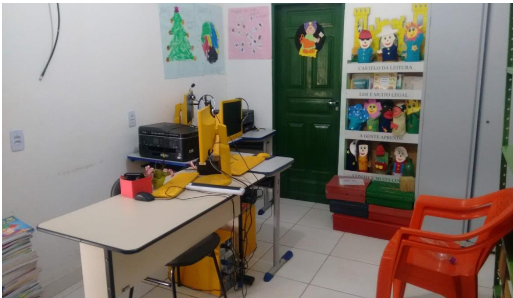
Imagem5 – Equipamentos Tecnológicos

No município de Barcarena, onde foi realizada a pesquisa, segundo a professora é realizado dois encontros de planejamento voltados para essas classes. Um é realizado no início do ano letivo e o outro no começo de agosto. O planejamento é preestabelecido, mas cabe ao professor ajustá-lo da melhor forma para o seu trabalho. No que diz respeito ao plano de aula, como a escola não apresenta corpo docente, fica a critério do professor a organização dos seus. A escola apresenta meios tecnológicos como computador, porém há ausência de internet e na maioria das vezes os mesmos ficam sem utilização sendo que poderia da subsidio a professora na hora de construir o plano de ensino para as turmas (Imagem 5).