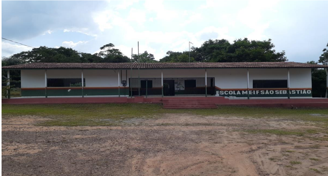
Imagem2 – Fachada Principal da Escola