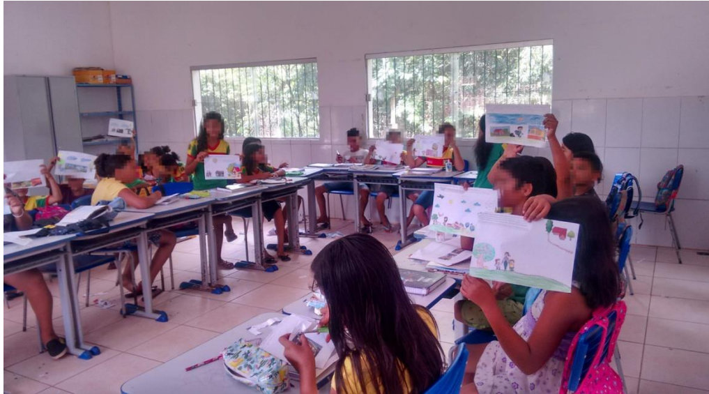
Imagem 4 – Trabalho relacionado ao campo