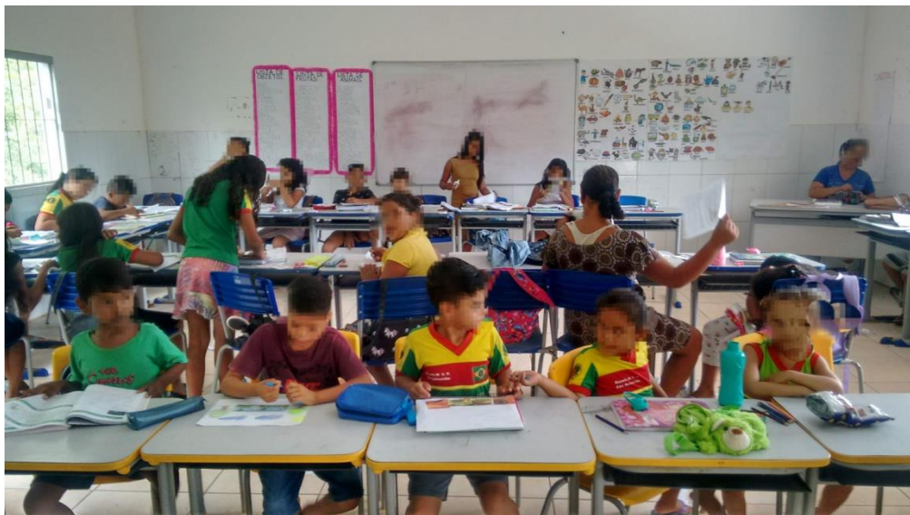
Imagem3- Alunos de educação infantil à frente

Diante disso, outro fator que também deve ser levado em consideração se dá a respeito de a escola atender alunos do Jardim I ao 5º ano. De acordo com a Lei de Diretrizes Complementares da Educação do Campo (2008), em seu artigo 3º, a educação deve ser oferecida na própria comunidade, desde a Educação Infantil aos anos iniciais do Ensino Fundamental. Porém, em seu parágrafo 2º desse mesmo artigo, estabelece-se que “em nenhuma hipótese serão agrupadas em uma mesma turma crianças de Educação Infantil com crianças do Ensino Fundamental.” Entretanto, na escola estudada isso não acontece, pois há alunos da Educação Infantil com alunos do Ensino Fundamental menor (Imagem 3).