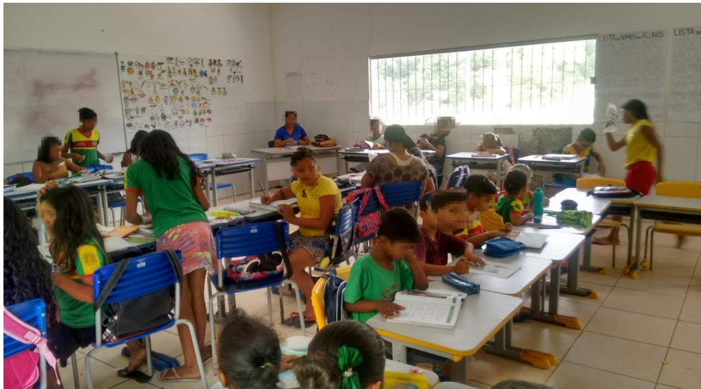
Imagem 7 –Interação entre alunos

que funcionam com essa forma de ensino. Já na matemática, a dificuldade está pelo fato de o aluno não entender direito, o que leva a não conseguir responder às atividades proposta pela professora. Dos cinco alunos entrevistados, apenas um disse não ter dificuldade com as disciplinas, afirmou gostar de todas. Dentro dessas classes, sempre há alunos que não apresentam dificuldade nas disciplinas, vindo a ocorrer deles próprios darem suporte aos outros alunos que sabem menos, ou seja, essa troca de saber se faz presente nessas classes (Imagem 7). Para Hage (2005, p.46) “[...] a multissérie oportuniza o apoio mútuo e a aprendizagem compartilhada, a partir da convivência mais próxima estabelecida entre estudantes de várias séries na mesma sala de aula [...].