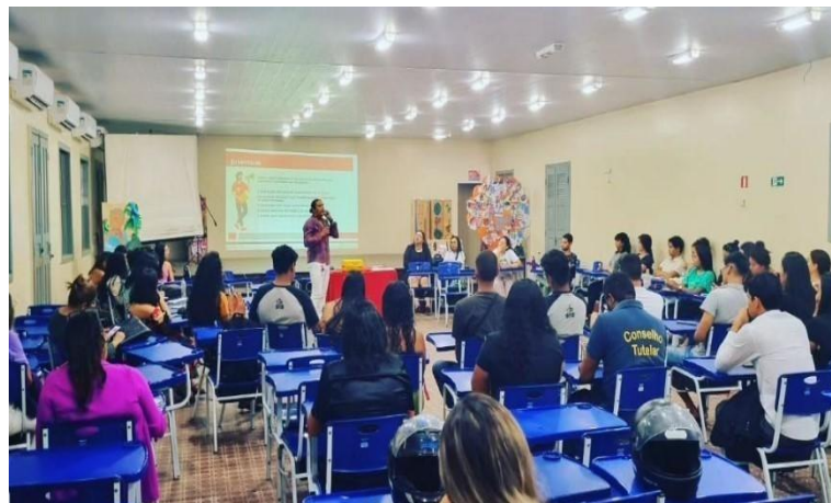
Figura 1 – Encontro de profissionais da socioeducação e bolsistas PIBID.

Não obstante, com a realização de palestras com uma série de pessoas que estavam envolvidas na socioeducação (Figura 1), onde os Pibidianos puderam ouvir as experiências de professores, conselheiros tutelares, magistrados, pedagogos e psicólogos, que explicaram como funciona esse aparato estatal para lidar com adolescentes em conflito com a lei, essas conversas serviram para desmistificar todo esse imaginário.