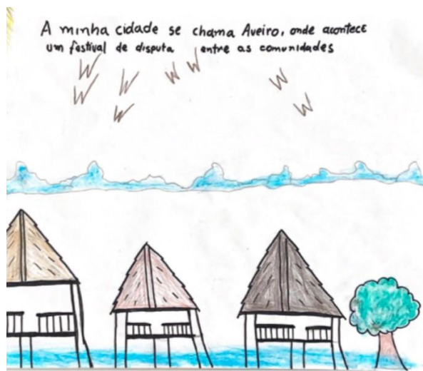
Figura 5- Desenho feito por socioeducando sobre a moradia de sua cidade

A figura 4 retrata um evento que acontece no município de Gurupá-PA, durante o mês de dezembro, segundo relato do aluno que desenhou a figura, o evento se chama “Dezembrada” e esse evento reúne todos do município durante três dias, um momento de grande significado e alegria, onde a sua infância permanece viva em seus pensamentos. Podemos ir além com mais relatos de mais adolescentes, como é o caso da figura 5. Ouvir esses relatos ressignificam a relação entre professor e aluno, pois estar em um ambiente atípico da socioeducação não propicia tal aproximação, entretanto buscar formas de trazer o aluno e instigá-los em prol da educação e uma ressocialização pode significar uma vida ganha no sentido de mostrar que eles têm a chance remodelar sua vida, se libertando desse viés punitivo que não oportuniza outras opções.