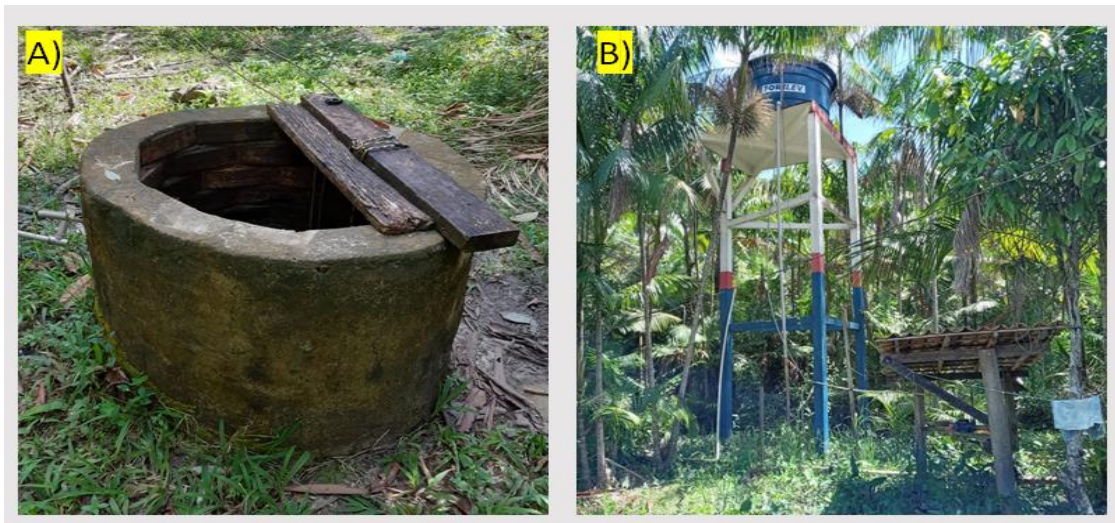
Figura 2 — Fontes de captação de água na comunidade quilombola do Médio Itacuruçá. A) Poço raso. B) Poço profundo (poço semiartesiano)