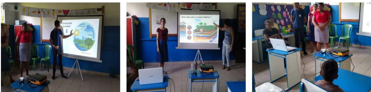
Figura 4 — Momentos da aula expositiva. A) apresentação do ciclo da água; B) lençóis freáticos; C) interação com a plateia

A palestra iniciou com a apresentação da equipe executora e do projeto destacando a água e seu ciclo biológico (Figura 4). Do elemento água, o conceito de água mineral foi introduzido usando as etiquetas coladas nas garrafas, a importância de ter esses minerais em concentração adequada na água foi destacada. O uso de imagens e de uma linguagem acessível para o público participante foram privilegiados; a participação dos alunos foi também incentivada. Por exemplo, foi perguntado aos alunos se a água podia desaparecer do planeta; visto a hesitação das crianças e as opiniões bem divididas entre eles, a conversa foi orientada sobre a possível falta de água de boa qualidade e não mais do elemento água.