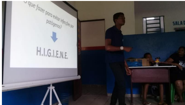
Figura 5 — Tópico de cuidados com o corpo e higiene.

Segundo Amorin, Tomazi e Silva (2013) a ausência de condições mínimas de saneamento básico associada a práticas de higiene pessoal e doméstica inadequadas são os principais mecanismos de transmissão dos parasitos intestinais.