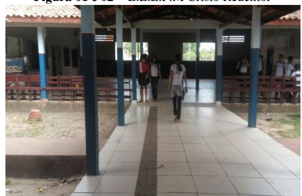
Figura 01 e 02 – E.E.E.F.M Cristo Redentor