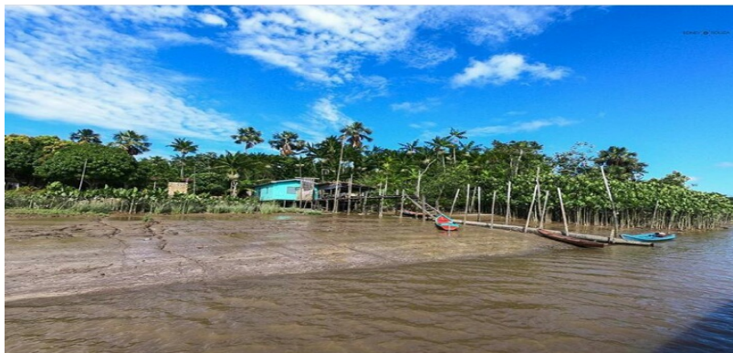
Imagem 4 – o miritizeiro usado como fonte de ligação das residências

Da árvore do miritizeiro tudo se aproveita, do grelo ou broto, fabrica-se cortinas e bolsas; da raiz se faz xaxim vasos; a polpa da fruta é usada para fazer sorvetes, picolés e ainda mingau e licores e o doce de buriti. Da polpa se extrai um óleo que é utilizado na fritura de peixes. As folhas têm várias utilidades, as novas são utilizadas para a fabricação de redes e cordas e as adultas para a cobertura de canoas e casas. Os talos são utilizados na tecelagem. O pecíolo por ser um material leve e mole é utilizado no artesanato regional, principalmente na fabricação de brinquedos. Os troncos imersos e apodrecidos desenvolvem o “turu” que são larvas, que podem ser comidas cruas com alto valor protético. Os troncos que não estão apodrecidos têm facilidades em flutuar e por isso servem como estivas (pontes que ligam as casas ao porto) nas casas ribeirinhas.