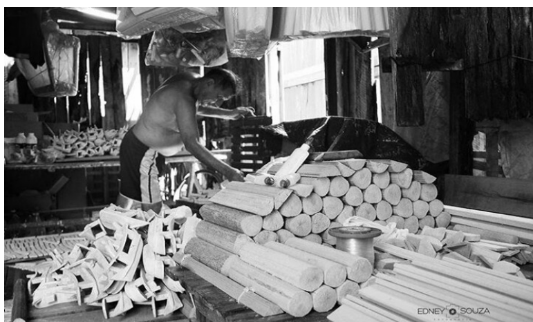
Imagem 5 – o artesão separando seu material de trabalho, os braços do miritizeiro

Segundo Lobato (2001) “O artesão é um homem feliz, para ele é um divertimento e uma alegria imensa criar com suas mãos abençoadas os brinquedos que trarão felicidade a tantos rostos anônimos”.