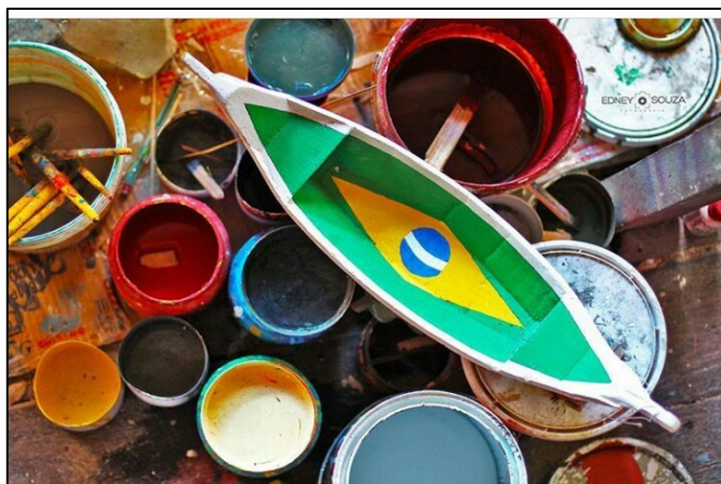
Imagem 3 – A Bandeira do Brasil, representada na canoa de miriti.

Abaetetuba é uma cidade, que tem um poder cultural muito forte, sua representação no estado, foi tendo cada vez mais destaque com o reconhecimento do brinquedo de miriti dentro do contexto cultural, de forma nacional e internacional, exemplo quando o brinquedo de miriti estava visível na copa do mundo no ano de 2014, por ter sido selecionado entre os 10 artefatos do mundo para ser exibido mundialmente através de sua apresentação na copa.