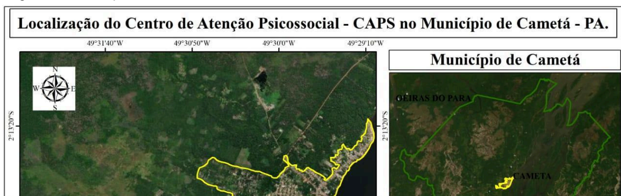
Mapa 02 – Localização do CAPS em Cameté.