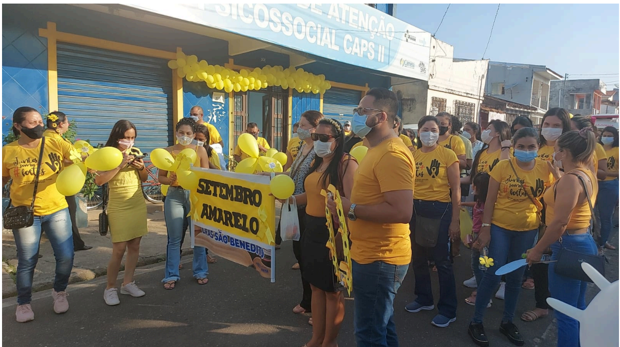
Figura 1: Caminhada “setembro amarelo”.

No dia 15 de setembro de 2021, o CAPS II- Cametá, em parceria com a prefeitura municipal, realizou uma caminhada simbólica em prol do “setembro amarelo”, com o objetivo de conscientizar a população sobre as doenças mentais, como depressão e ansiedade (Figura 1).