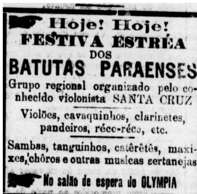
Figura 1 – Jornal Estado do Pará