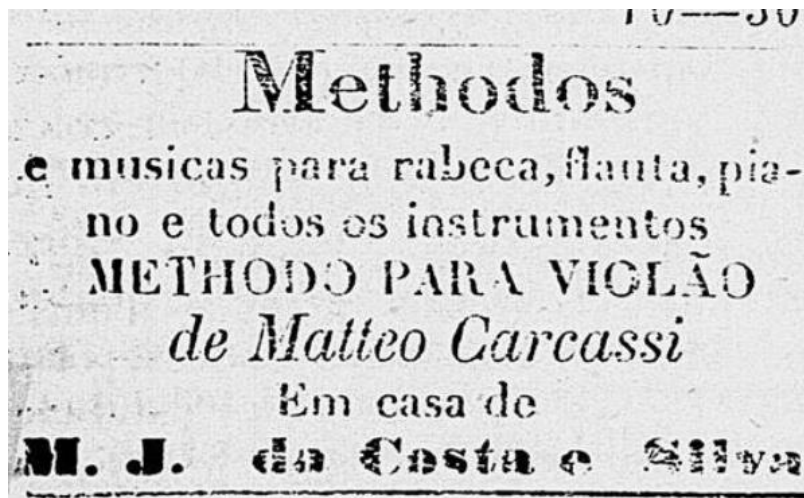
Figura 5 – Anúncio de um método para violão clássico do compositor italiano Matteo Carcassi

Fonte: Gazeta de Notícias , 2 de Agosto de 1881, p. 3 - Hemeroteca Digital Brasileira