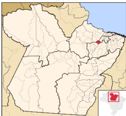
Figura 01: Localização do município de Abaetetuba

A zona rural é subdividida em duas áreas: as ilhas e o centro. A primeira é constituída por 72 ilhas interligadas por diversos rios, com predominância de terrenos de várzea e está localizada a oeste do município, separada pelo rio Maratauíra da zona rural “centro”, que fica a leste formada por terra firme e integrada por ramais e estradas (MACHADO, 2008). Nas figuras abaixo são mostradas a localização do município de Abaetetuba no estado do Pará (figura 01) e da Escola Dondon Pinheiro (figura 02).