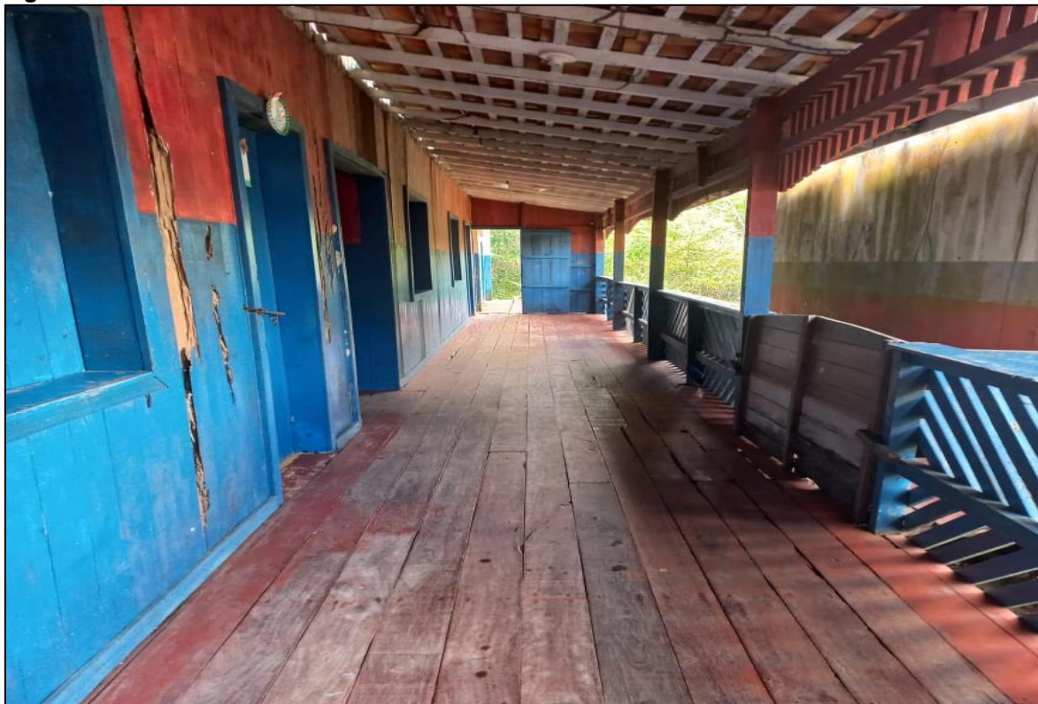
Figura 6: Corredor da escola Dondon Pinheiro