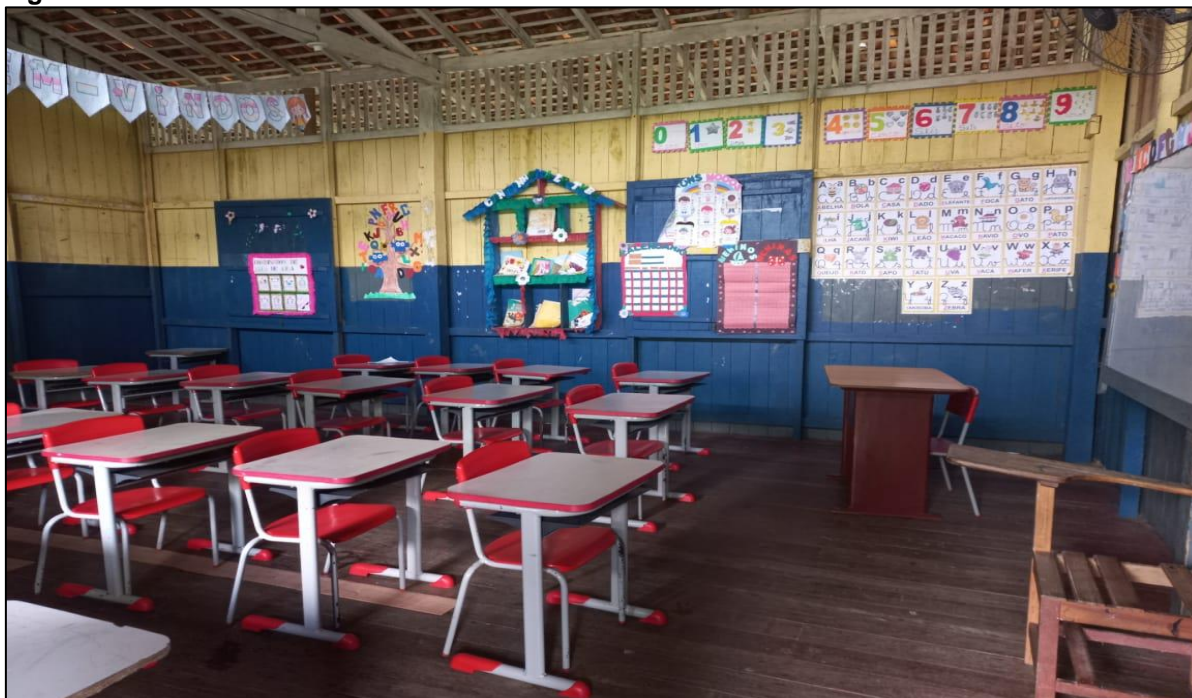
Figura 4: Sala de aula da escola Dondon Pinheiro.