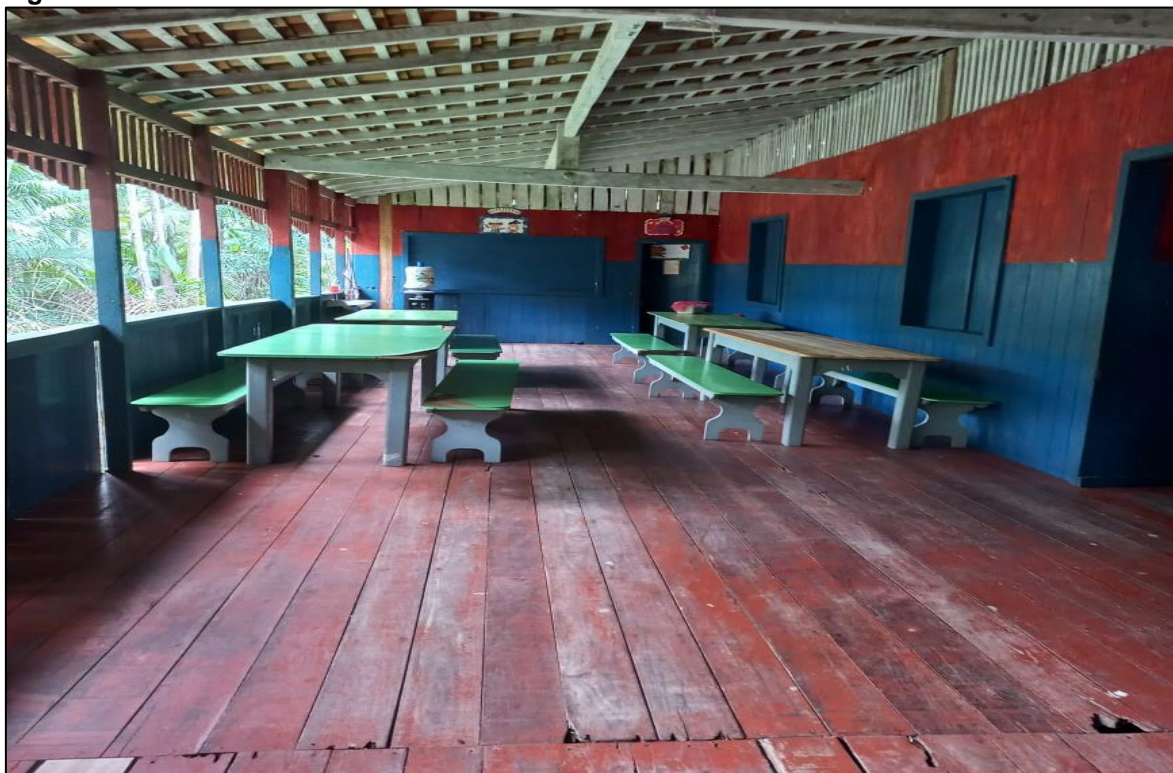
Figura 5: Refeitório da escola Dondon Pinheiro.