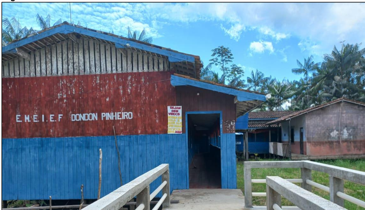
Figura 3: Vista frontal da escola Dondon Pinheiro.

comunidade escolar. Nas figuras a seguir, são apresentas algumas fotos do prédio da escola.