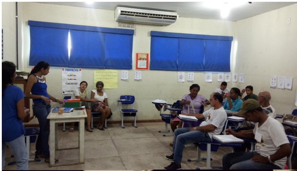
Figura 1: Ambientação do Espaço Pedagógico da Turma Multifacetada.