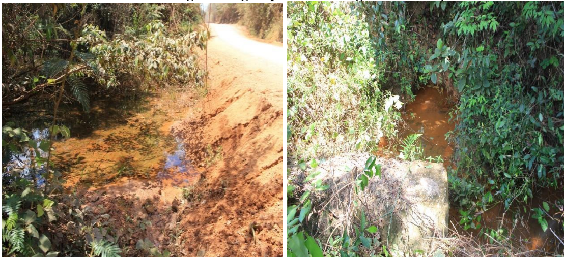
Fotografias: Elielson P. Silva, agosto de 2019