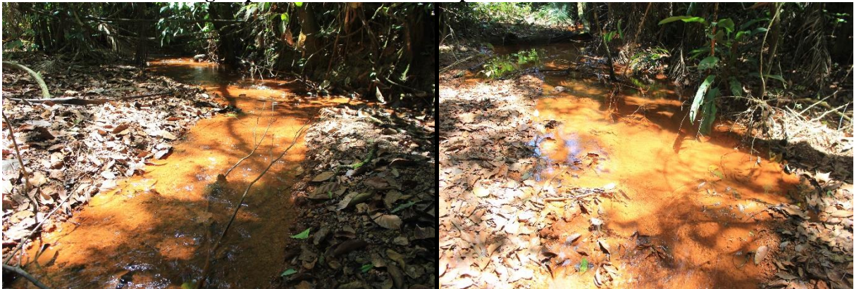
Fotografias: Elielson P. Silva, agosto de 2019