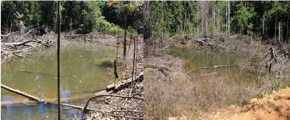
Fotografias: Elielson P. Silva, agosto de 2019