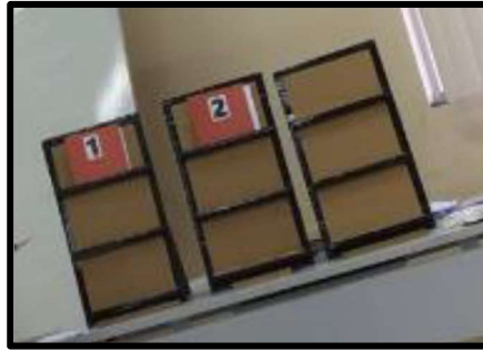
Figura 1 – Conjunto Triplex.

O jogo é realizado da forma tradicional, que implica completar uma sequência de três símbolos iguais (X ou O), seja na horizontal, vertical ou diagonal. Entretanto, para marcar um ponto, é necessário responder à pergunta correspondente. Após explicação minuciosa sobre o funcionamento da atividade, a turma será dividida em dois grupos, G1 e G2, definindo-se no “par ou ímpar” qual grupo começará o jogo e qual o símbolo (X ou O) de cada grupo.