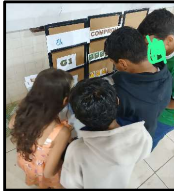
Figura 6 – Variação do Triplex verbal.

Foram utilizados aproximadamente 22 verbos que possibilitaram os estudantes formarem frases com OD e com OI, foram utilizados verbos como: esqueceu, precisa, foram, aprendi, ganhei, comi, abraçou etc. Os alunos continuaram bastante participativos e até apontavam em “coro” outros colegas para que fossem participar também. Alguns aceitavam, outros ficavam muito acanhados e não aceitavam ir à frente participar, porém, mesmo de suas carteiras auxiliavam os colegas na formação das frases e na identificação dos objetos. Os alunos fizeram perguntas quando tinham dúvidas diante de algum erro. Um exemplo foi em uma frase que eles formaram e nela havia o artigo indefinido “um” e eles confundiram com uma preposição. Além dessa dificuldade no reconhecimento das preposições, foi possível notar que alguns alunos têm dificuldade na escrita. Um dos alunos, ao ir à frente, ao escrever a preposição “ao”, escrevia “au” trocando o “o” pelo “u”, outros começavam a frase com letra minúscula, assim como, no final da frase não colocavam a pontuação adequada. A cada um desses equívocos, parávamos e corrigíamos esses erros de forma bem tranquila e sem constranger o aluno.