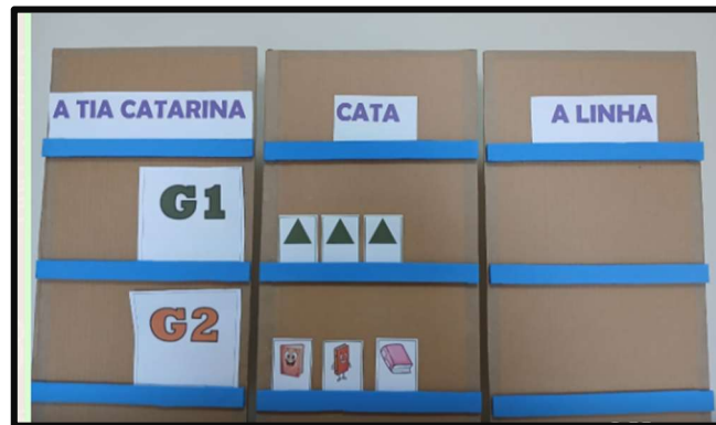
Figura 2 – Jogo Trio Verbal.