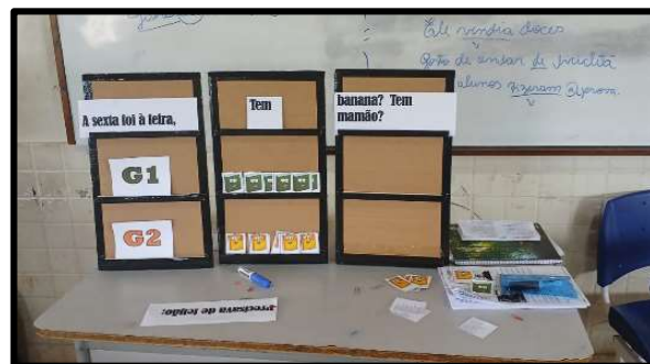
Figura 5 – Jogo Triplex verbal.

Após esse momento, os alunos foram convidados a participar da dinâmica denominada como Triplex verbal.