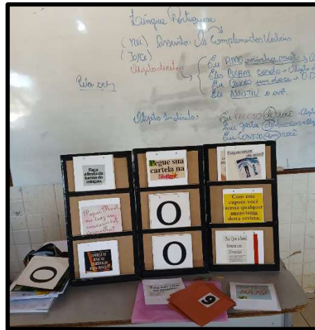
Figura 4 – Jogo da velha verbal.

Em seguida foi realizada uma atividade lúdica denominada “Jogo da Velha verbal”, os alunos ficaram bem eufóricos com a realização da atividade e participaram ativamente.