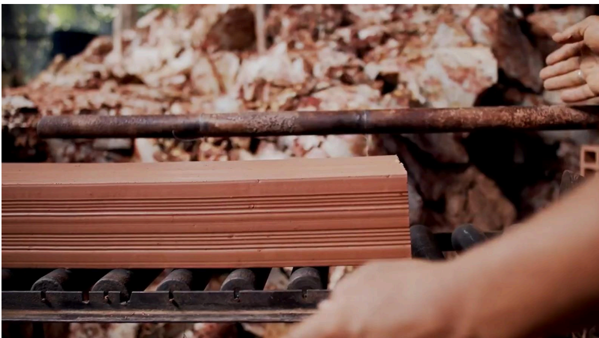
Figura 7 – Tijolo na cortadeira