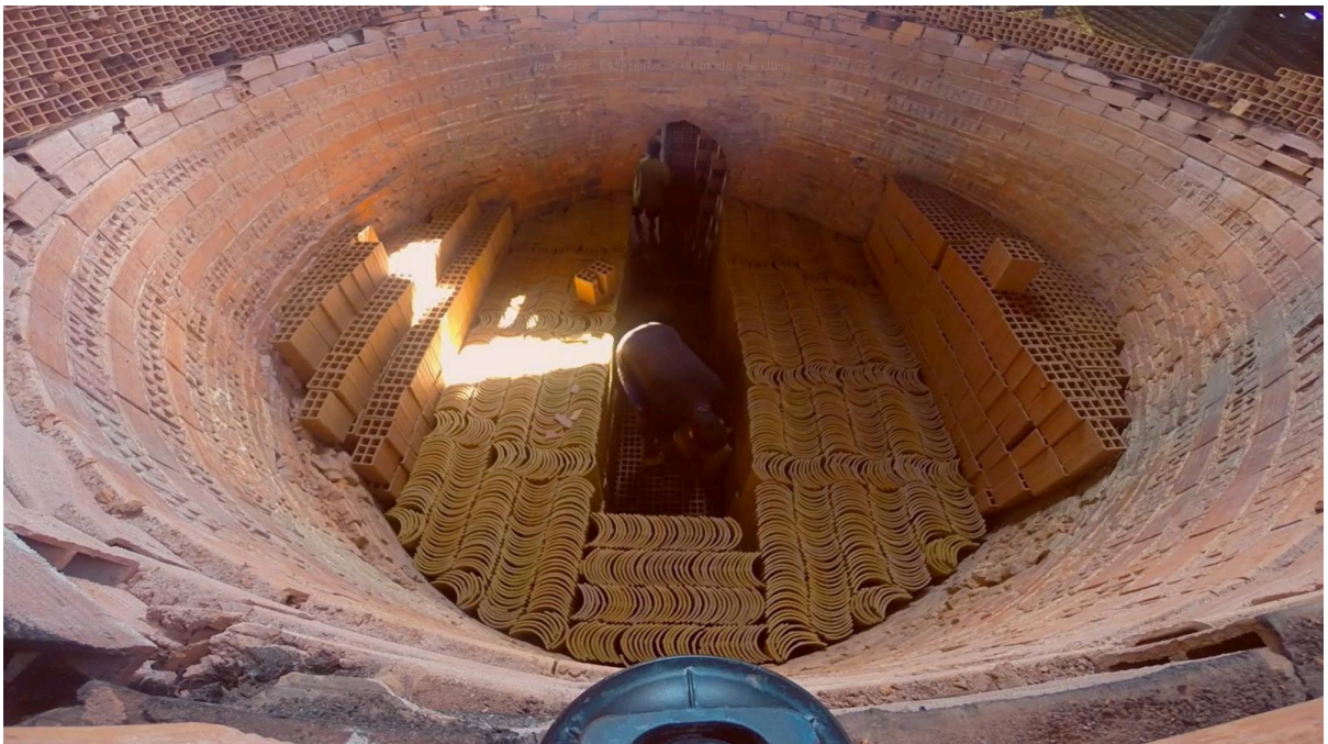
Figura 11 – Visão de dentro do forno de cozimento