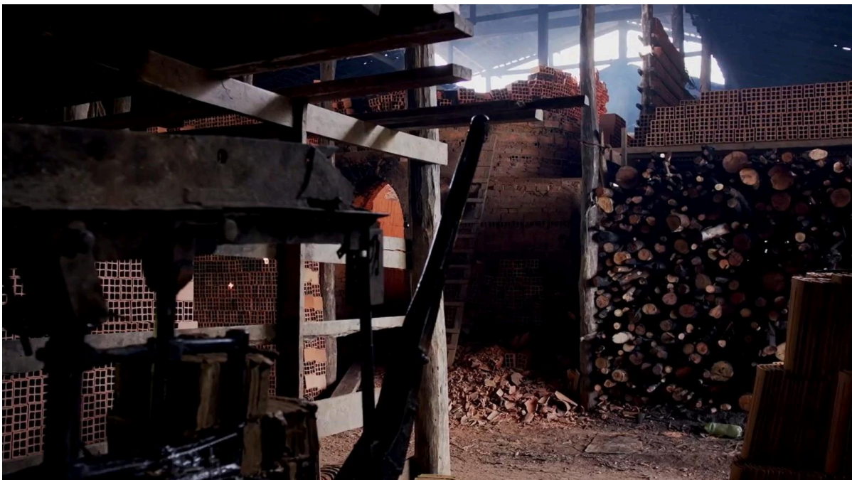
Figura 14 – Armazenamento de lenha do lado do forno