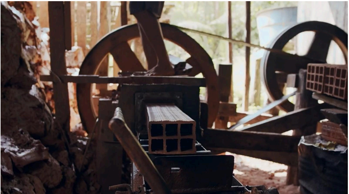
Figura 6 – O barro sendo moldado pela maromba