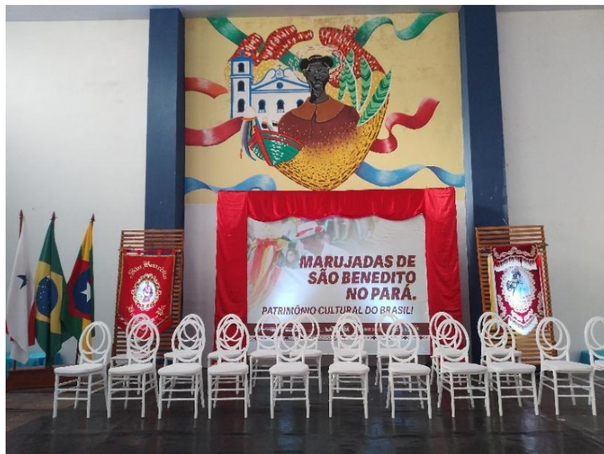
Figura 10 – Palco montado no dia da Certificação das Marujadas

Nesse movimento, um marco histórico do registro da pesquisa com as crianças foi acompanhar o dia 6 de dezembro de 2024, Dia da Certificação das Marujadas de São Benedito no Pará, que ocorreu no Museu da Marujada em Bragança. A organização deste momento foi alinhada pela Irmandade de São Benedito do município de Bragança, juntamente com o Instituto do Patrimônio Histórico e Artístico Nacional (IPHAN) no Estado do Pará, especialmente, a presença de Professores, pesquisadores e estudantes da Faculdade de História da Universidade Federal do Pará, Campus Universitário de Bragança. Na figura (10) mostra o palco preparado para o momento da certificação.