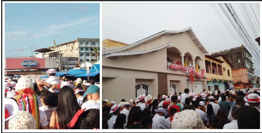
Figura 19 – Criança maruja, vestindo os trajes no ombro do adulto