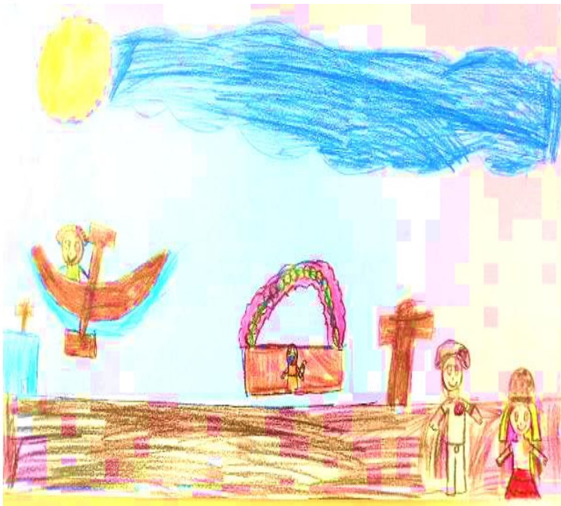
Figura 1 - Desenho do Largo de São Benedito