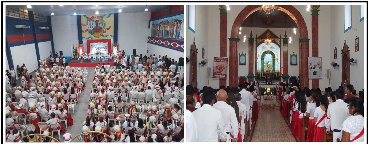
Figura 11 – certificação das marujas e missa em ação de graças

aclamadas como Patrimônio Cultural do Brasil, título concedido pelo Instituto do Patrimônio Histórico e Artístico Nacional (IPHAN). Na figura 11 visualizasse diversos marujas e marujos no Teatro Museu da Marujada no momento da cerimônia. Uma missa em ação de graças também é celebrada por este momento representativo, sob condução do Bispo diocesano da Diocese de Bragança, Dom Raimundo Possidônio.