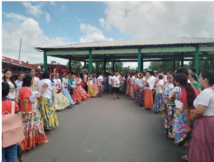
Figura 13 – mulheres marujas usando vestes estampadas para receber a comitiva

Na chegada do cortejo, o Santo da praia é recebido pelas mulheres marujas que formam um caminho para a comitiva seguir com a imagem até o palco no trapiche de Bragança. Nesse ritual as mulheres marujas são as protagonistas, uma vez que elas não participam das comitivas, apenas os homens assumem a função das esmolações.