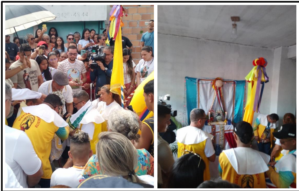
Figura 14 – A chegada da imagem peregrina de São Benedito da Comitiva da praia à casa de um promesseiro

A presença de muitos devotos que acompanharam o cortejo em direção a uma residência no bairro Aldeia. A Comitiva foi recebida com aclamação pela família que recebia a imagem de São Benedito entregue pelo Padre Elias ao devoto promesseiro que se ajoelha para receber o Santo em sua casa. Esse é momento atravessado de sentimentos de emoção, choro e alegria pelas pessoas. Em seguida o senhor promesseiro conduziu a imagem até o altar preparado na sala de estar da sua casa para o ritual da ladainha.