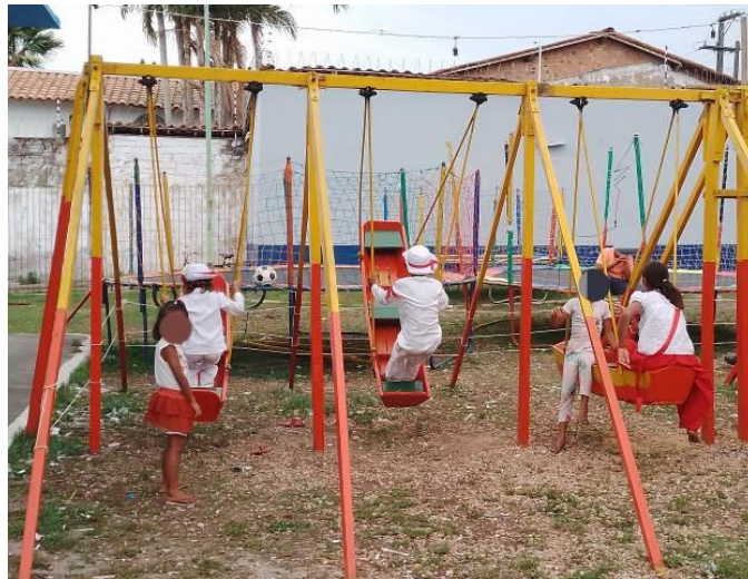
Figura 20 – Crianças brincando nos barquinhos próximos ao Barracão da Marujada