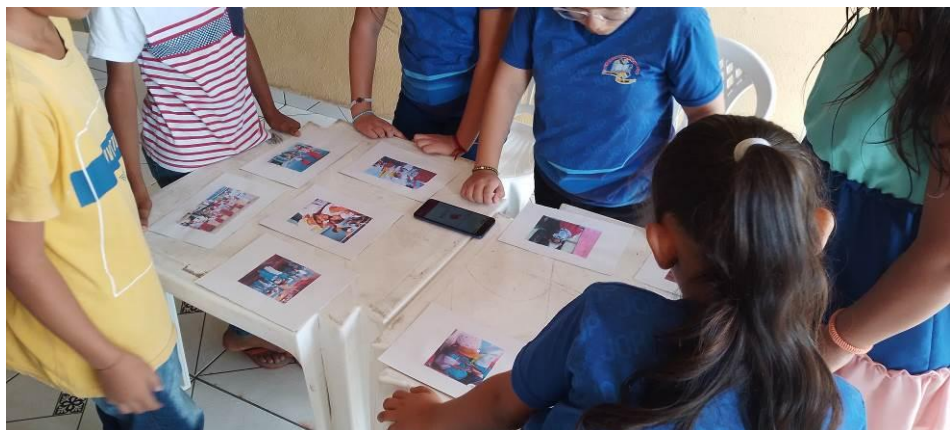
Figura 21 – Atividade do painel musical com imagens

As crianças marujas estudantes da Escola Júlia Quadros revelam o sentido de ser maruja e quem as influenciou. Assim, ao som da música do cantor e compositor bragantino Toni Soares, como a música “Já chegou São Benedito” e "Comitiva de São Benedito” foi iniciado a entrevista com as crianças. Foram indagadas se conheciam as músicas – responderam que sim e cantaram ao escutar e outras duas crianças ainda não conheciam. Assim, na atividade do painel escolheram uma fotografia e explicaram o motivo da escolha.