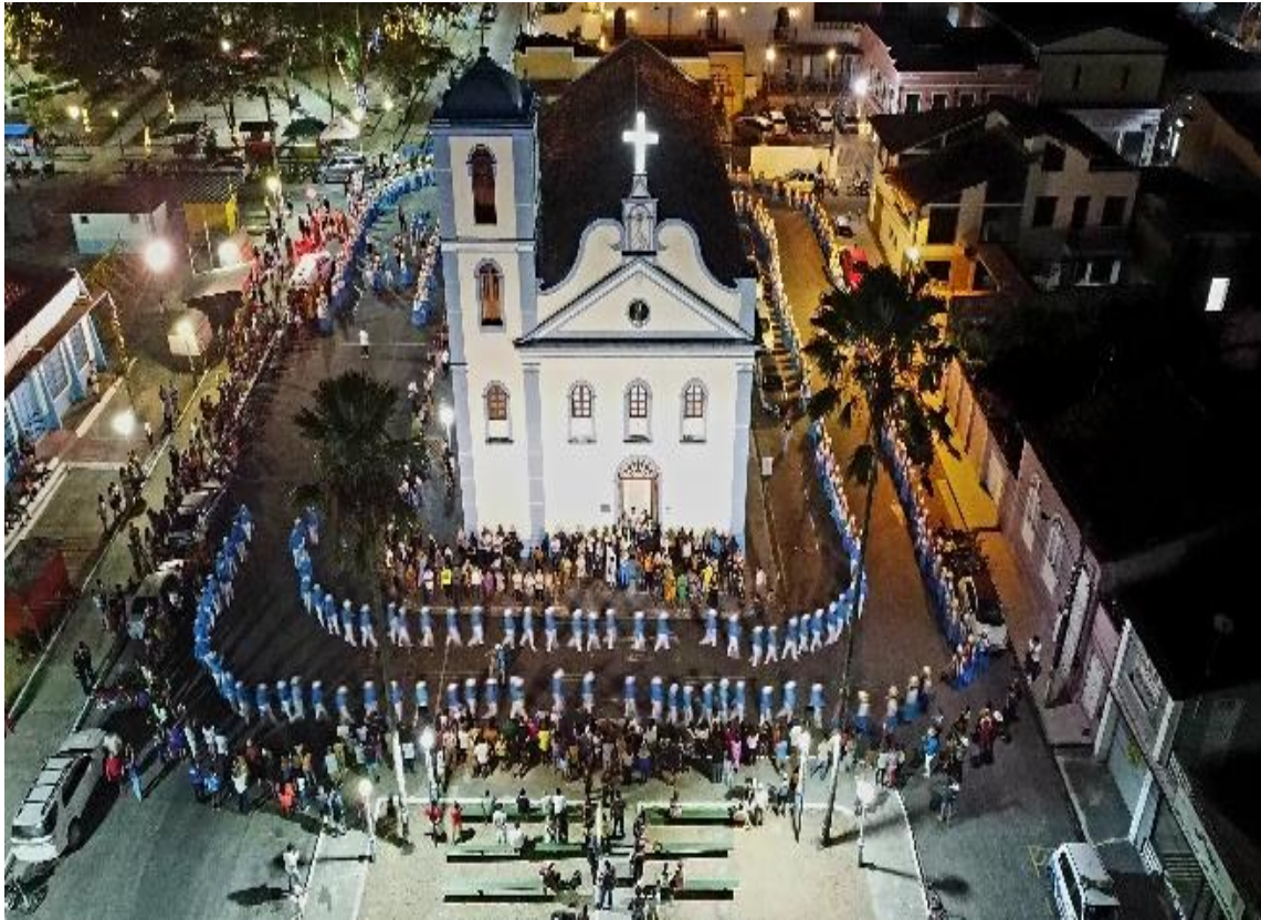
Figura 7 - Marujas e marujos abraçam a Igreja de São Benedito