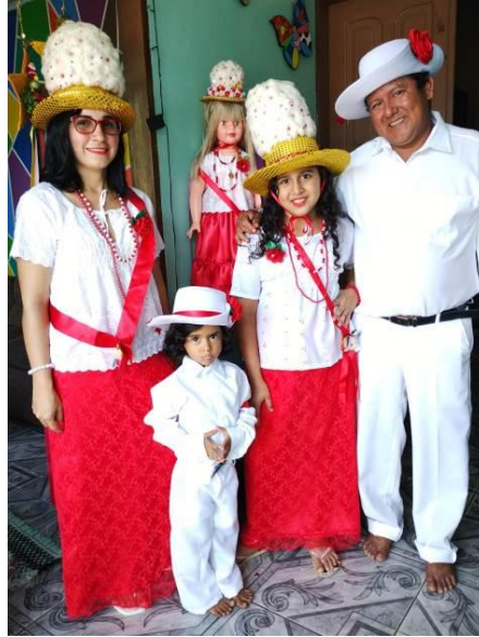
Figura 17 – Família de marujos (as)