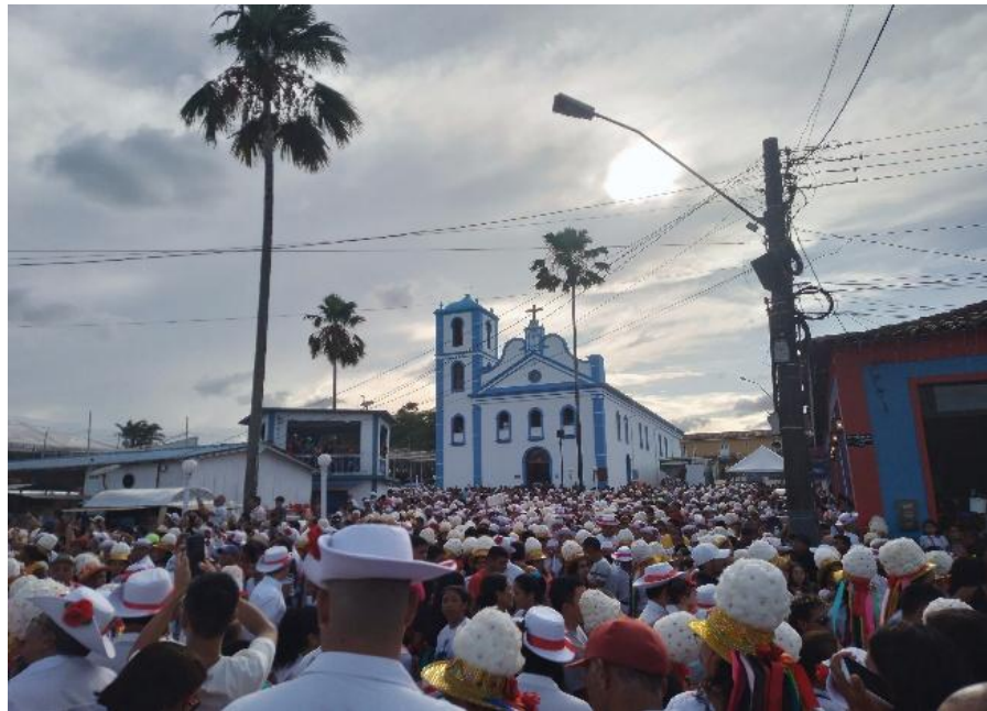
Figura 6 - Chegada do São Benedito à Igreja