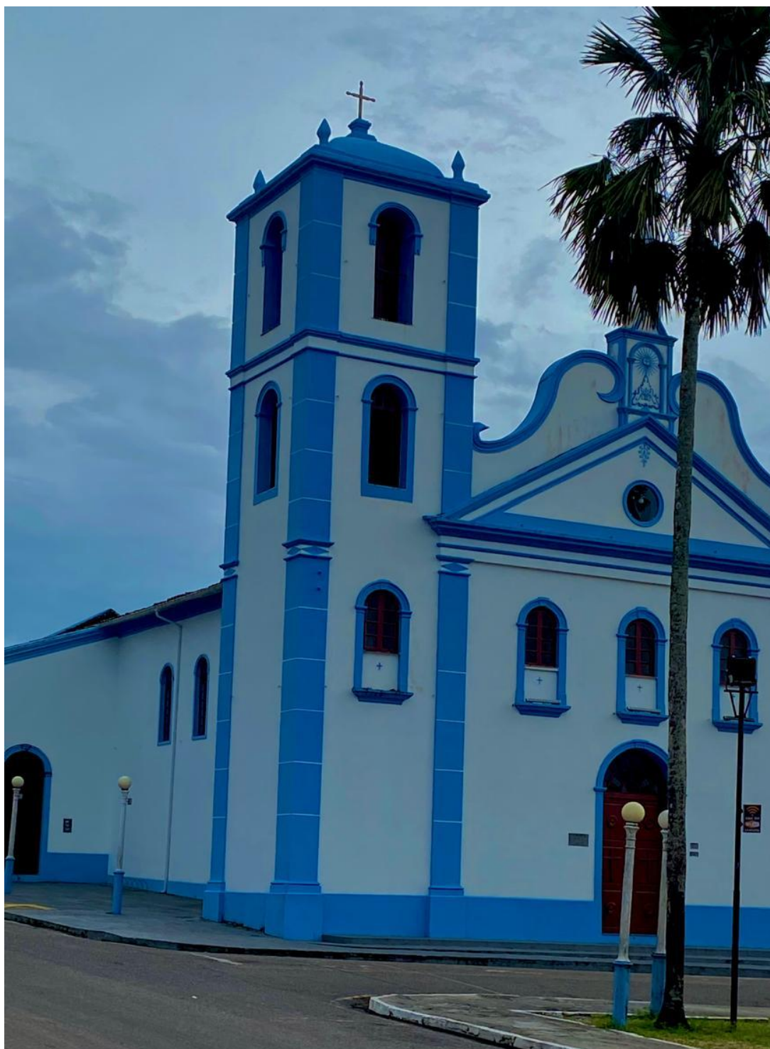
Figura 2 - Igreja de São Benedito