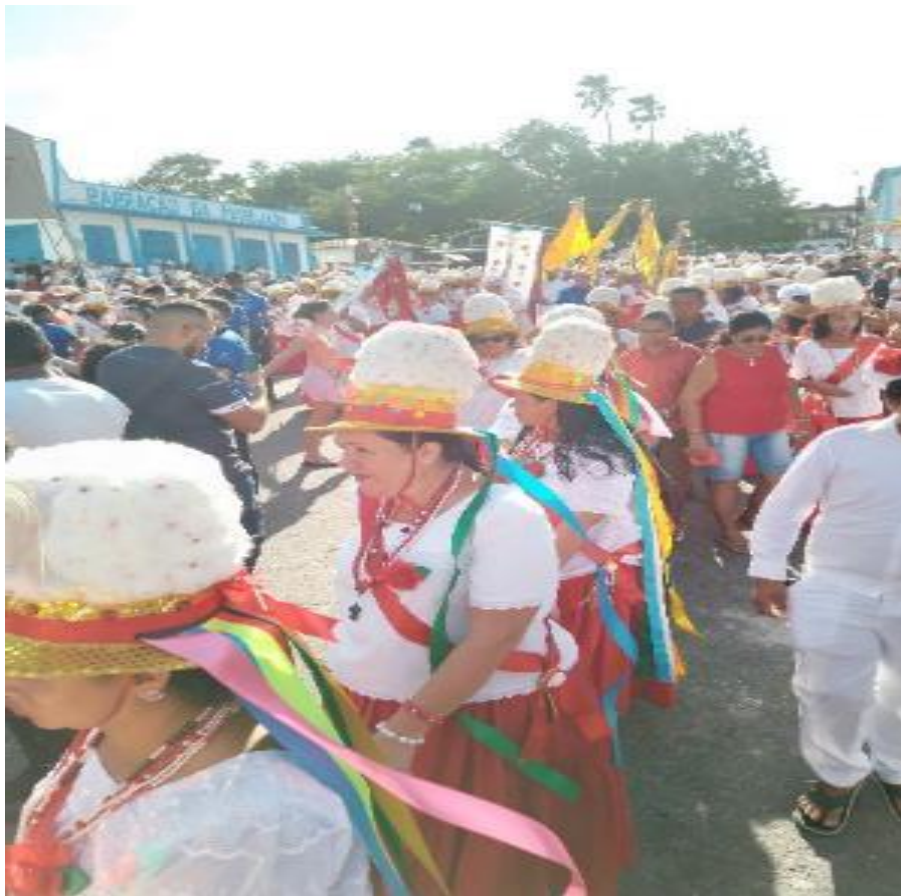
Figura 5 - Ala das marujas após a saída da igreja do andor de São Benedito

É possível pensar que a forte influência do culto afro-brasileiro e o lugar que as mulheres ocupavam nos templos seja a gênese do protagonismo das mulheres nessa manifestação. Uma tradição construída pelos pés descalços das negras e negros escravizados, mas que sofreram com a tentativa de apagamento de suas subjetividades, como parte do projeto de dominação colonial (Corrêa, 2020a. p. 51).