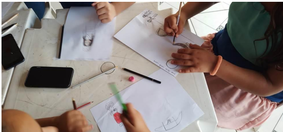
Figura 22 – As crianças marujas produzindo Arte sobre São Benedito

Na produção de desenhos, as crianças marujas na escola Julia Quadros mostraram as suas vivências e sentimentos comunicando uma linguagem artística.