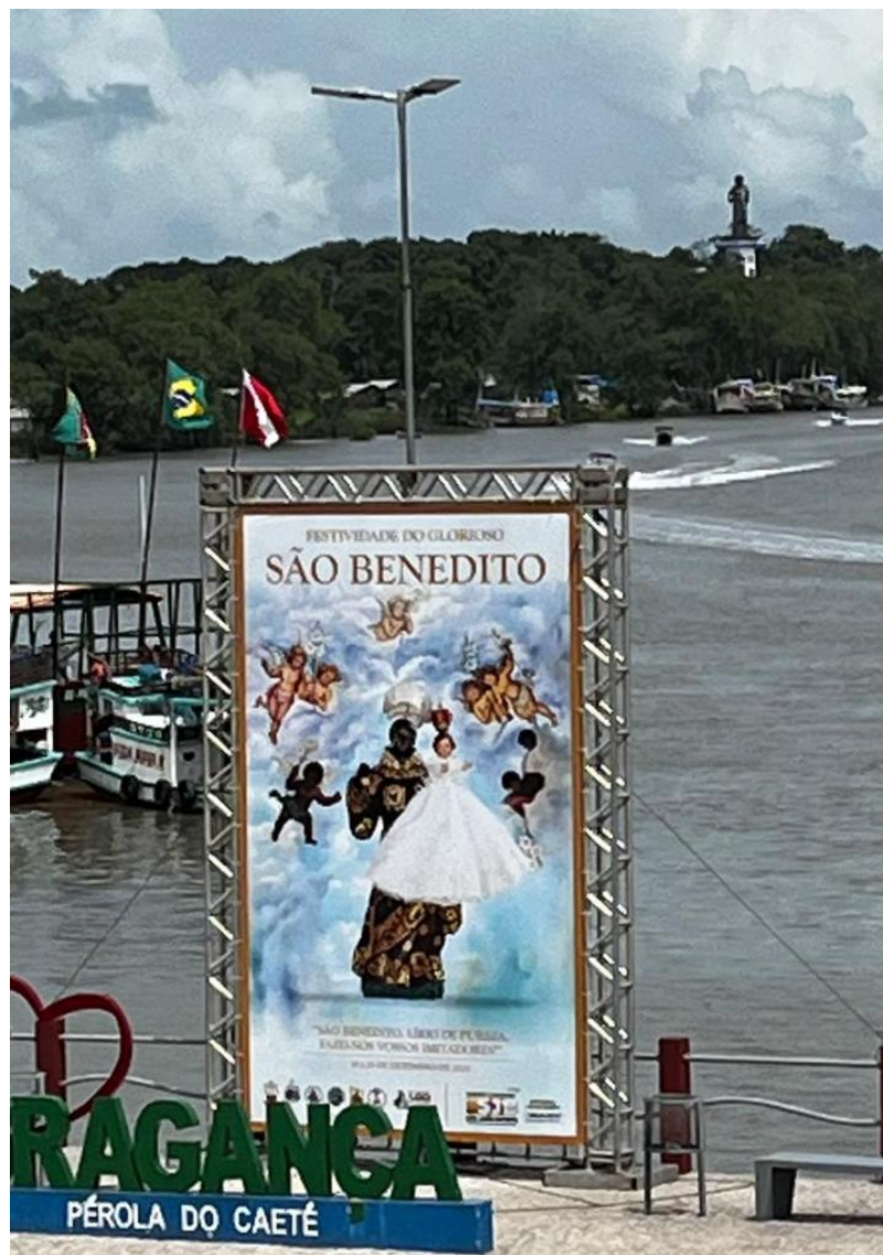
Figura 3 - Procissão fluvial do Santo da praia