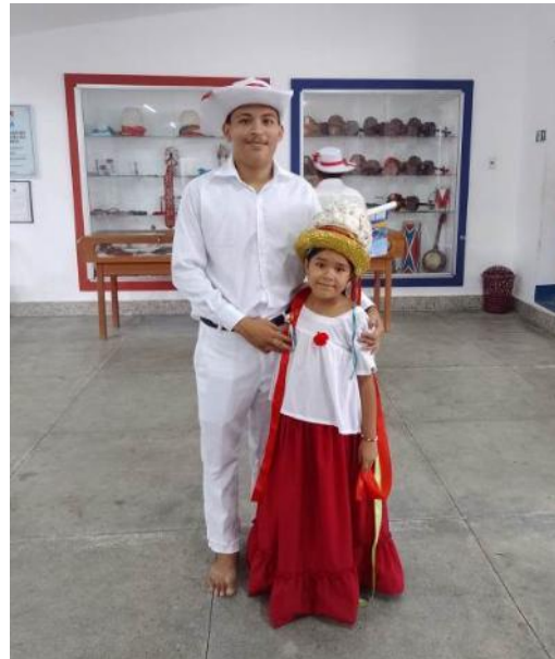
Figura 18 – irmãos marujos