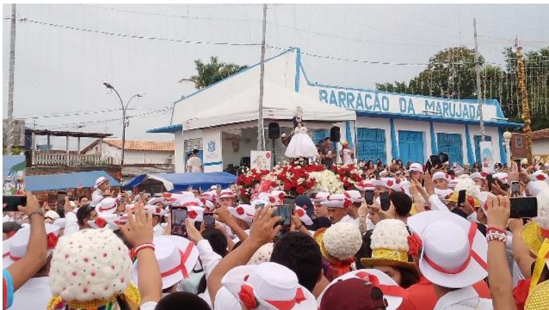
Figura 4 – Dia 26 de dezembro de 2023 - Procissão de São Benedito

A procissão solene com a imagem de São Benedito deixa a Igreja e sob a liderança da Capitoa e a vice-capitoa, é formado uma ala de marujas. Assim, segue esse corredor humano de marujas e a imagem no andor é conduzida pela multidão de devotos. Em 2023, a procissão iniciou às 16h saindo do largo São Benedito.