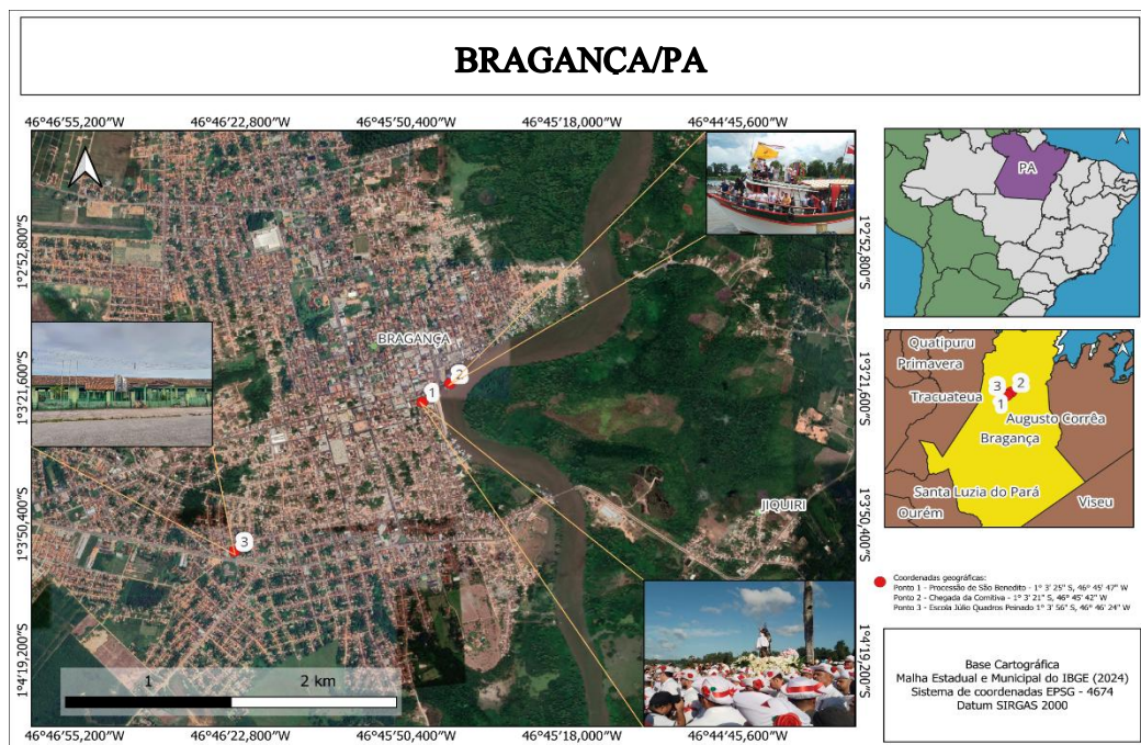
Figura 8 - Mapa geográfico de Bragança, Pará

Na figura 8 o mapa de Bragança, com destaque para procissão de São Benedito, a chegada da comitiva do Santo da praia e a Escola Júlia Quadros Peinado, que são os principais espaços da pesquisa e dos encontros dialógicos com as crianças marujas.