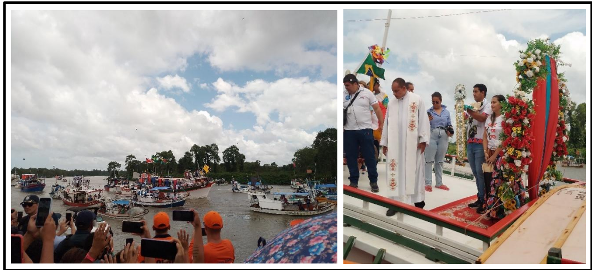
Figura 12 – chegada da comitiva de São Benedito da praia em romaria fluvial

No barco do Santo não foi registrado a presença de crianças marujas. Todavia, as crianças estavam em todos os espaços da orla e no trapiche.