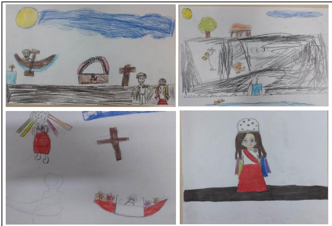
Figura 23 – Desenhos feitos pelas crianças marujas da escola Júlia Quadros