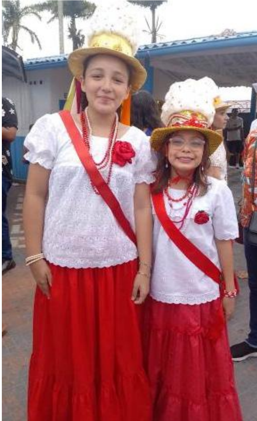
Figura 16 – Crianças marujas com as indumentárias