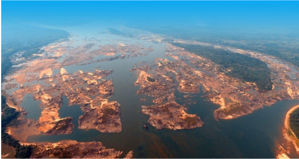
Figura 2: Pedral do Lourenço no período da estiagem.