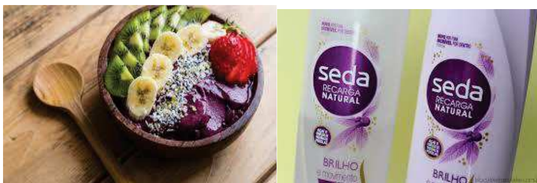
Imagem 14: Produtos à base de açaí

Já nas fábricas o açaí é processado e despulpado sendo congelado para ser exportado para vários estados brasileiros e também para o mercado internacional, onde será utilizado na produção de sucos, sorvetes, geleias, pudim, doces, corantes, pedidas isotônicas e de refrigerante, entre outros alimentos. O açaí também, por ser rico em carboidrato, proteínas e lipídios com alto poder de nutrição é usado para a fabricação de shampoo, condicionador, cremes, sabonetes, hidratantes, perfumes, esmaltes e também em produtos de maquiagem.