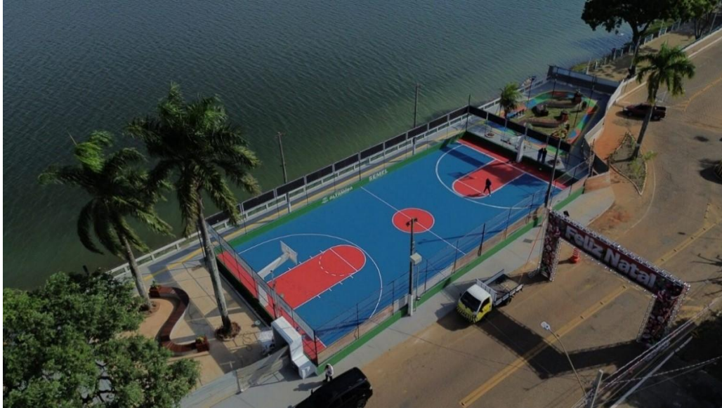
Figura 4 - Quadra de basquete em 2025.