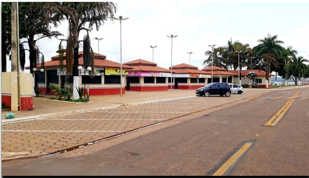
Figura 8 -Praça de alimentação

As Figuras 8 e 9 mostram a praça de alimentação nos anos de 2019 e 2025, evidenciando a readequação e homogeneização do espaço para a oferta de serviços gastronômicos.