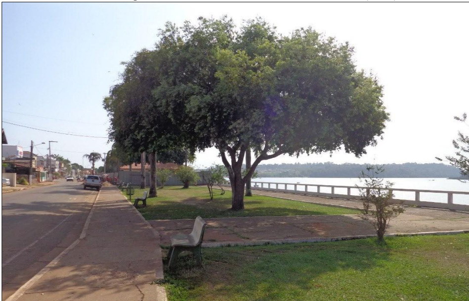
Figura 5 – Área da orla ainda não modificada (2015)

Na figura 4 é demonstrado o trecho localizado nas proximidades dos quiosques e da quadra de basquete, espaço que foi transformado em uma praça destinada ao lazer e à convivência. Essa transformação evidencia a ampliação das funções do espaço público, incorporando novos usos voltados ao lazer e à permanência da população, o que contribui para a valorização da Orla do Cais e para a redefinição de suas dinâmicas socioespaciais.