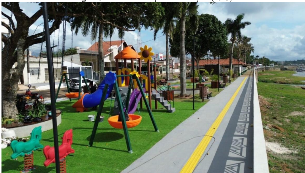
Figura 6 – Área da orla após modificações (2025)