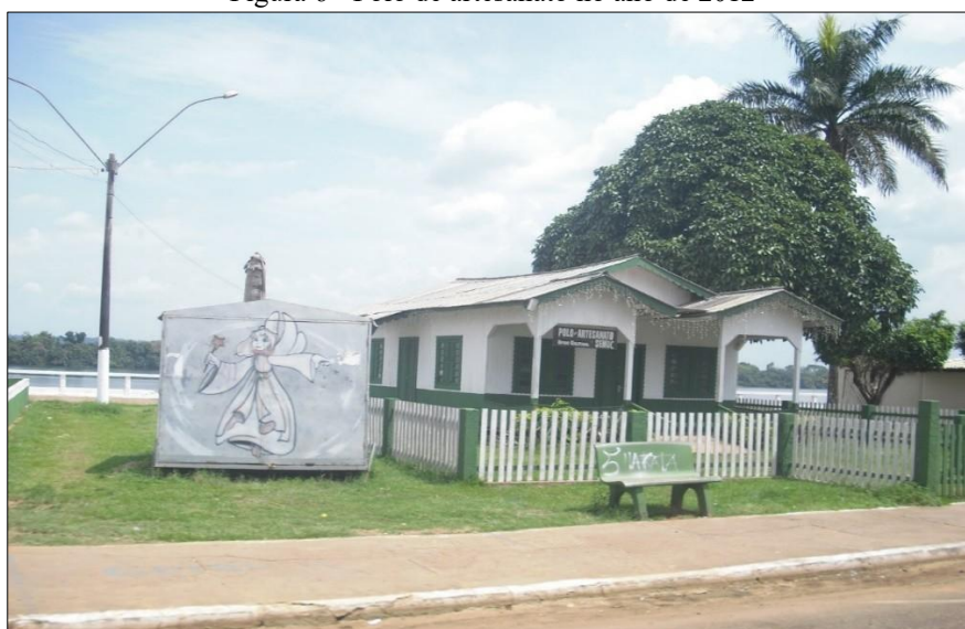
Figura 6 - Polo de artesanato no ano de 2012

As Figuras 6 e 7 revelam a revitalização do Polo de Artesanato ao longo dos anos. Esse espaço é destinado à comercialização de produtos artesanais locais e serve como apoio às atividades econômicas ligadas à cultura e produção artesanal da região.