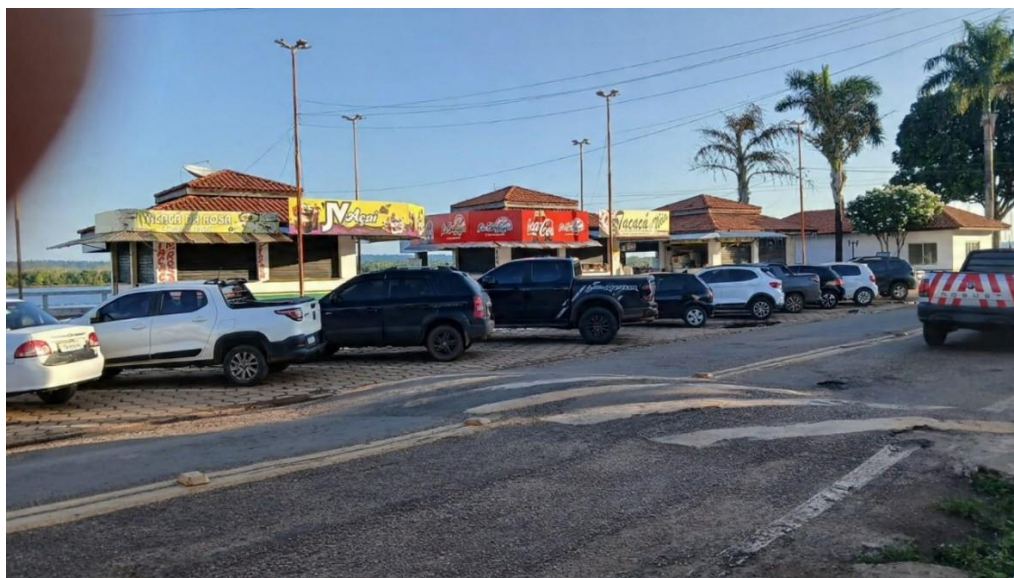
Figura 9- Praça de alimentação atualmente