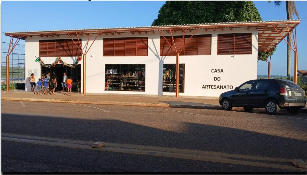
Figura 7 - Polo de artesanato atualmente.