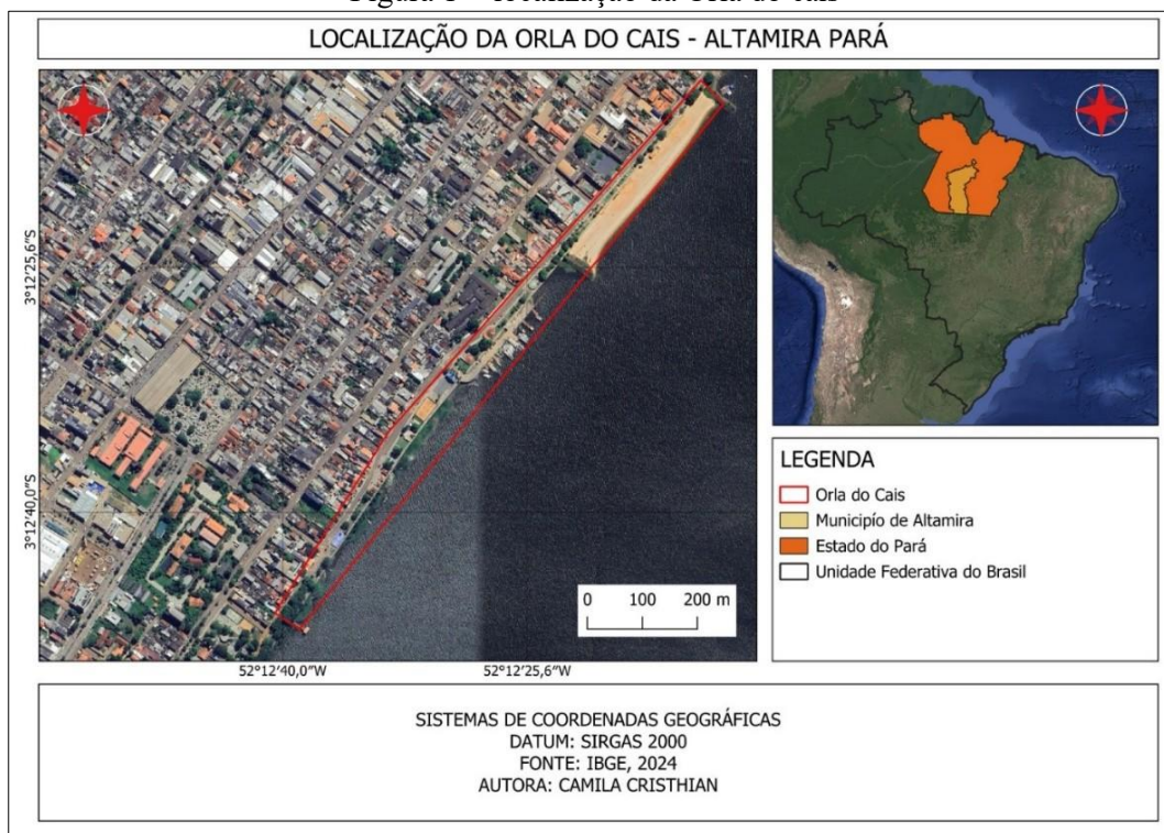
Figura 1 - localização da Orla do cais

A área de estudo deste trabalho corresponde à Orla do Cais, localizada às margens do rio Xingu, no município de Altamira-PA, ao longo da Avenida João Pessoa. Trata-se de um trecho estratégico do espaço urbano, diretamente associado à dinâmica fluvial e à organização socioespacial da cidade, integrando a área central e concentrando usos voltados ao lazer, à circulação e às atividades comerciais. Para fins de contextualização espacial, a Figura 1 apresenta a localização da Orla do Cais no contexto geográfico do município de Altamira, possibilitando a identificação do recorte territorial analisado.