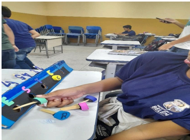
Figura 1 – Aluna A com material pedagógico.