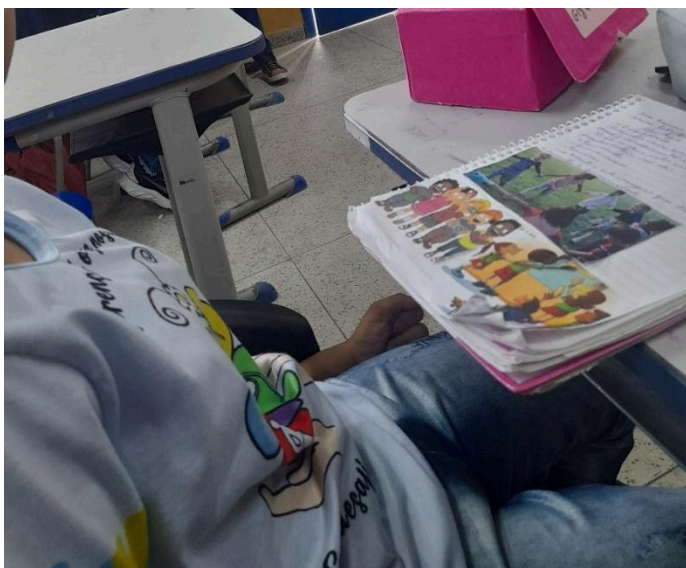
Figura 3 – Aluna A realizando atividade de colagem.