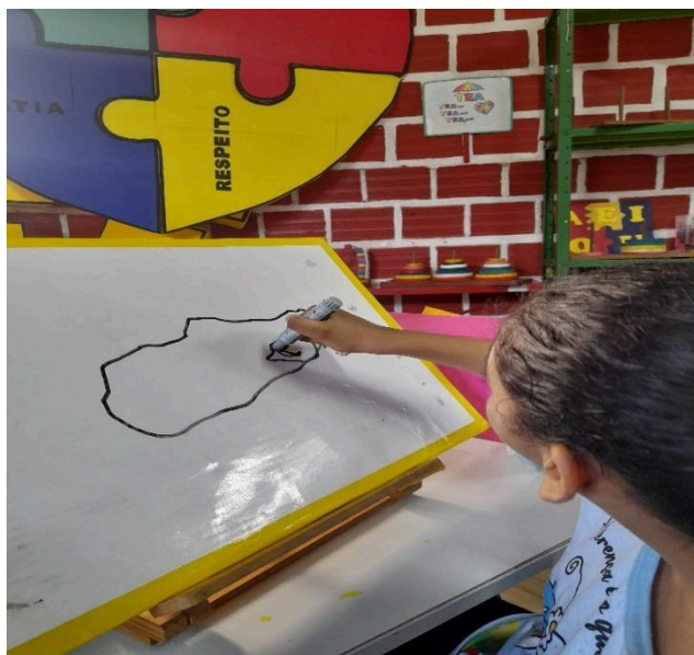
Figura 4 – Aluna A manuseando recursos adaptados.