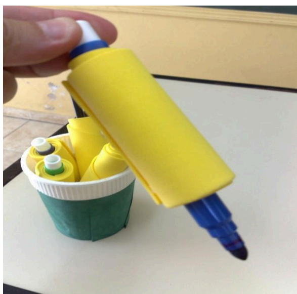
Figura 5 – Lápis adaptado para a aluna A.