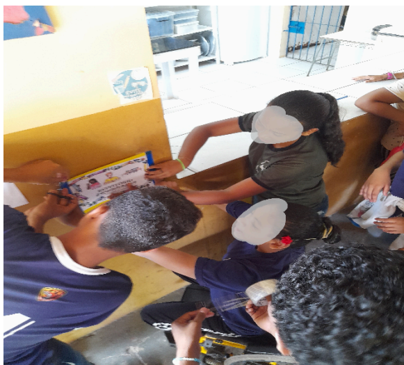
Figura 7 – Aluna A participando de uma atividade sobre inclusão no espaço escolar.