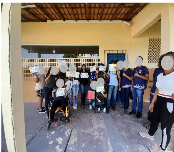
Figura 6 – Aluna A participando do Clube do Livro.

Esse lápis adaptado, mais grosso, por exemplo, proporciona à aluna uma pegada mais firme. Lápis triangulares ou com revestimentos emborrachados ajudam a oferecer mais estabilidade e conforto durante o uso, podendo ser uma alternativa eficaz para minimizar as dificuldades motoras. É fato que nem todos os alunos com paralisia cerebral conseguem se adaptar ao lápis; cabe ao professor analisar se essa alternativa será viável ou não para cada estudante.