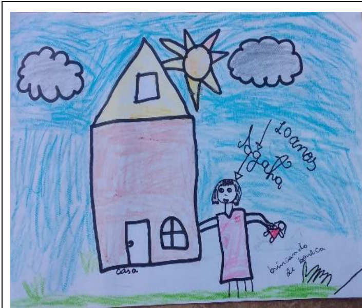
Desenho 1 - O lar e o brincar de boneca.

“Essa é minha casa e eu brincando lá fora de boneca” (AGATA, 10 anos).