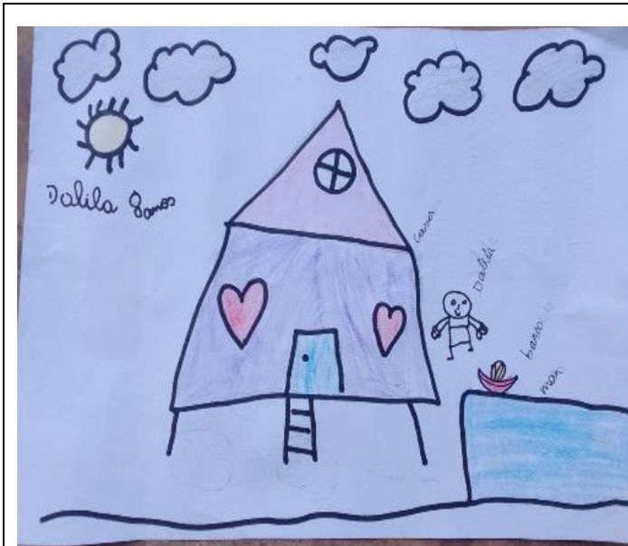
Desenho 2 - Meu lar e brincar na praia.

“Desenhei minha casa, o sol e nuvens. E aqui sou eu também brincando na praia” (DALILA, 8 anos).