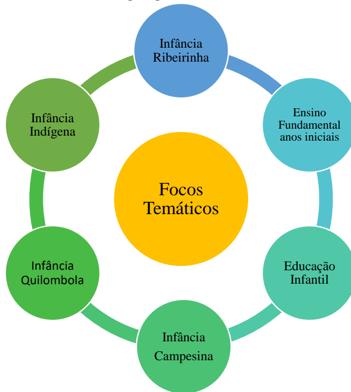
Organograma 2 - Focos temáticos.