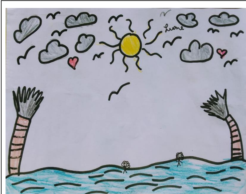
Desenho 8 - Cartografia Social: Banho na maré.

“Nesse desenho aqui eu fiz a praia por que é um lugar que gosto muito” (LUANE, 10 anos).