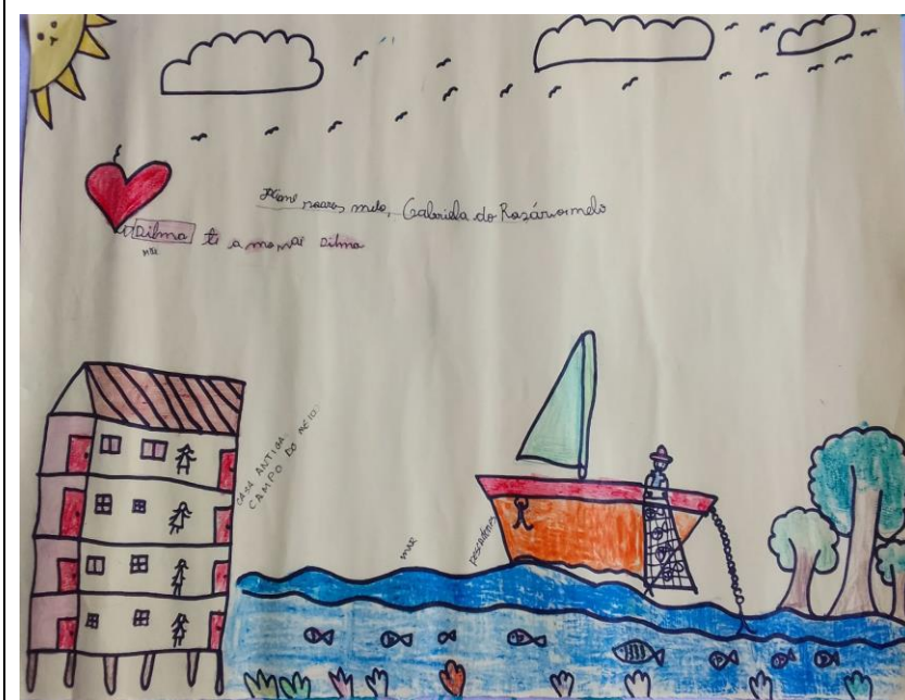
Desenho 6 - Cartografia Social: A casa de muitos andares e um pai no mar.