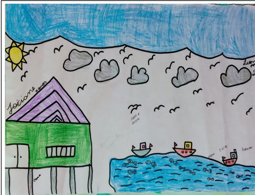
Desenho 5 - Cartografia Social: A casa e o mar.

“Desenhemos minha casa, a praia com vários barcos e com muitos peixes” (JOICIANE, 10 anos).