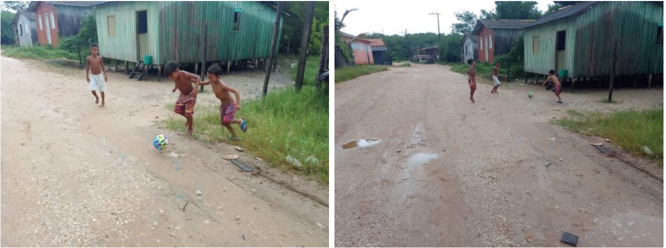
Figura 3 e 4 - Meninos brincando de bola na estrada no final de tarde.