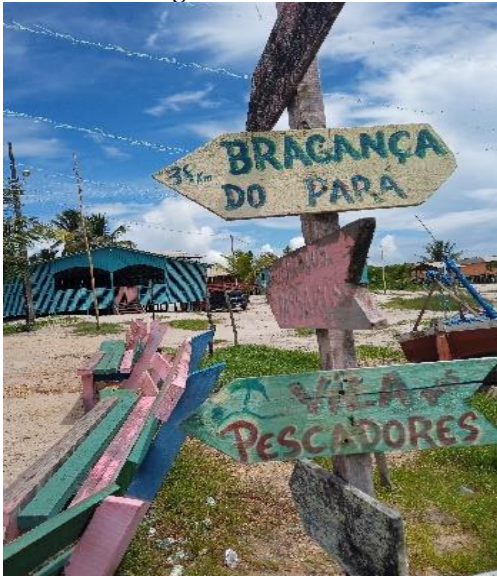
Figura 1 - A vila.