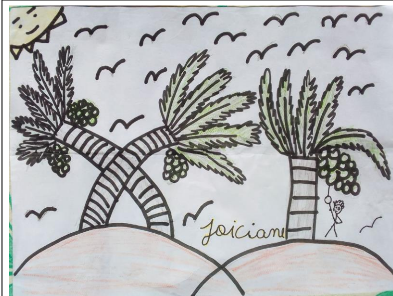
Desenho 7 - Cartografia Social: O apanhar de coco.

“Eu desenhei a praia, mas é onde tem coqueiros que gosto de apanhar coco e venta muito” (JOICIANE, 10 anos).