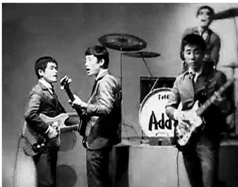
Imagem 4: Banda Add 4 em referência aos Beatles nos anos 60.

estavam em seu pleno surgimento e o cinema coreano, outro ponto importantíssimo dessa cultura, mostrava com vigor seus primeiros sinais. Dentre os pontos destacados, a música pop coreana crescia disparadamente, apresentava diferentes traços e, com isso, o Rock ia introduzindo-se no cenário musical. O Trot continuava com toda sua popularidade e consagrado na Coreia do Sul. Os artistas que se influenciaram pela cultura ocidental e performavam nos clubes, criaram durante seu apogeu, uma popularidade maior. O interesse na música era evidente e crescente, mais ainda depois da chegada da Beatlemania 12 no país, o rock ganhou novas proporções. Daí surgiu a primeira banda de rock da Coreia do Sul, a Add4, criada em 1962. Competições musicais com o gênero rock tomavam conta do país com a sua popularidade.