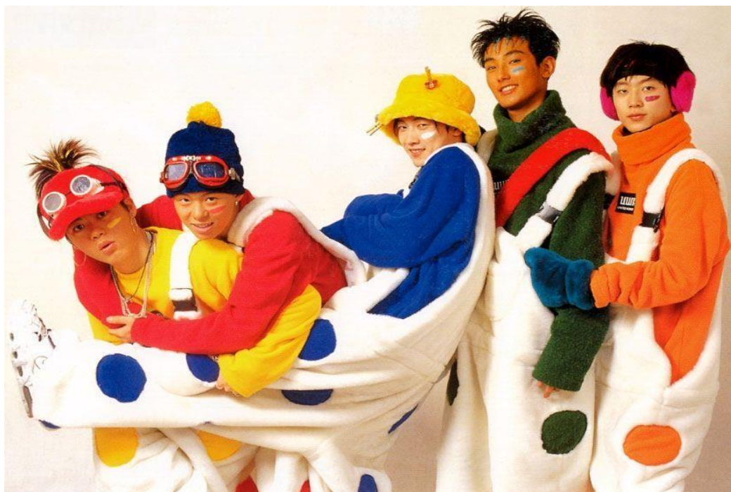
Imagem 8: H.O.T em 1996

H.O.T entrou em cena para iniciar o fenômeno K-Pop de grupos de garotos e garotas que dançavam. O grupo encontrou grande sucesso e popularidade durante suas atividades de 5 anos, mas acabou por se separar em 2001. O grupo tornou-se o ícone de toda uma geração e uma inspiração para famosos grupos, como SM, S.E.S, Shinhwa, TVXQ, Fin K.L., Super Junior, SHINee, EXO, etc.