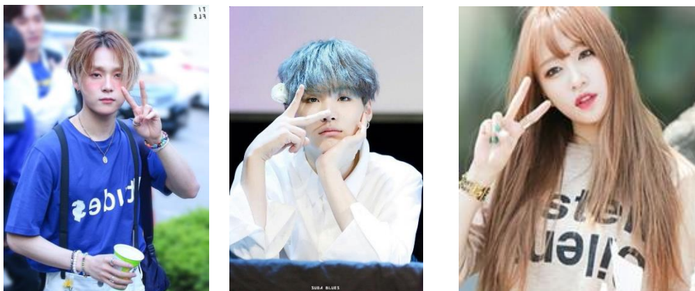
Imagem 17: Idols.