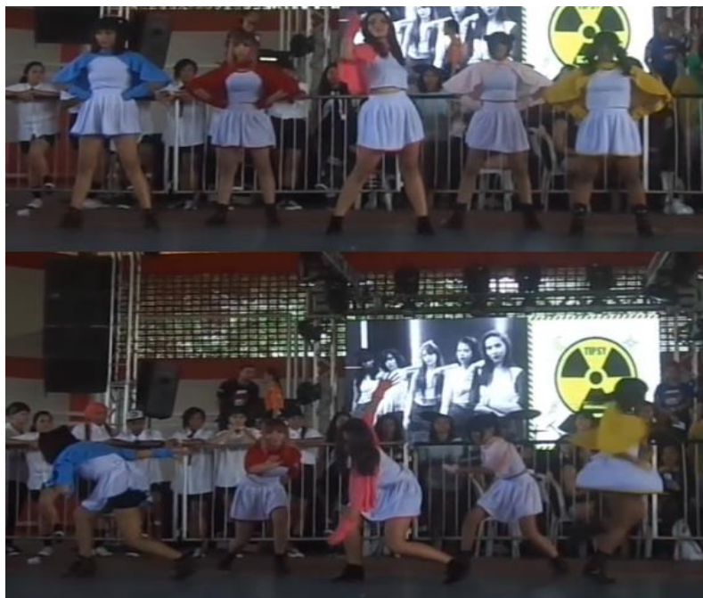
Imagem 23: Fotos retiradas do vídeo gravado da apresentação do grupo Lótus Imperiums.

Nossa apresentação foi muito meiga. Ficamos em primeiro lugar. A imagem a seguir é sobre esta apresentação.