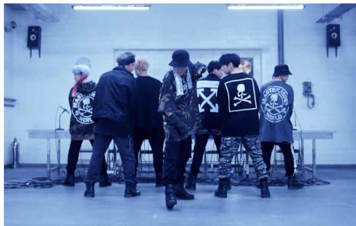
Imagem 14: BTS em MicDrop.

Apesar de sermos apenas cinco, adaptamos a coreo e a formação para que pudéssemos dançar a música, já que estávamos tão empolgadas com ela, e seria nossa primeira apresentação como grupo oficial, em outras palavras, nosso debut.