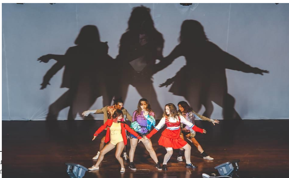
Imagem 27: Apresentação do Grupo Lótus Imperiums no Evento K-Pop 4Fun.

Porém, antes de sairmos tivemos nossa última apresentação como o grupo Lótus Imperiums. O evento que já estava batendo na porta era o K-Pop 4Fun, já tínhamos nos inscrito, não queríamos desperdiçar a vaga. Dançamos uma coreo de sete meninas, adaptando-a para nós cinco: Hobgoblin do CLC 55 . Não estávamos tão confiantes, não estávamos nos sentindo à vontade, mas, como parecia que iria ser nossa última apresentação juntas, dançamos.