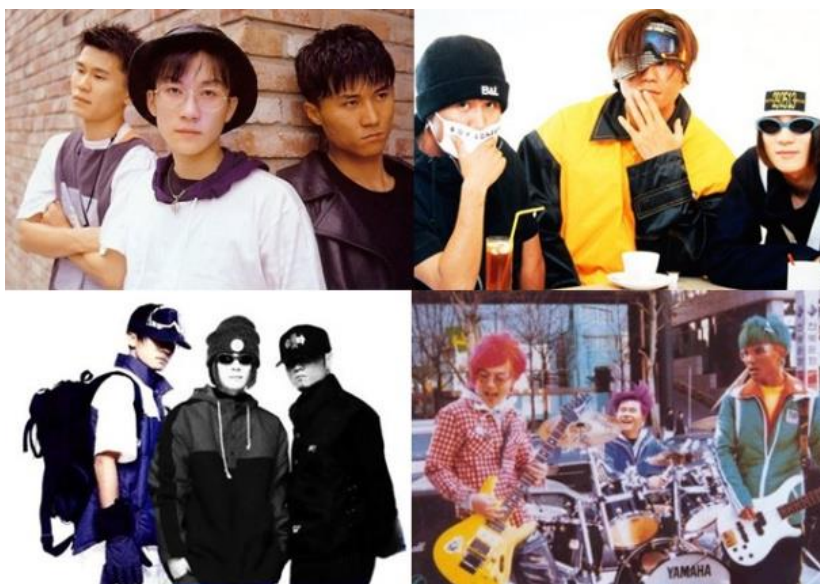
Imagem 6: Grupo Seo Taiji & Boys

Pela grande popularidade de Seo Taiji & Boys, os adolescentes foram reconhecidos pelos industriais musicais como audiência demográfica. Com a mídia fazendo proveito dessa ascensão do poder dos adolescentes coreanos, a indústria musical focou toda sua capacidade e esforços na tão conhecida música pop, focada nos jovens dos anos 90. Na segunda metade da década, essa transformação foi fundamental para o nascimento dos grupos de ídolos (K-POP: A New Force in Pop Music, 2011, p. 51, tradução da pesquisadora).