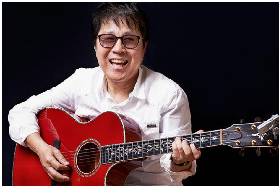
Imagem 5: O cantor Pop Coreano, Cho Yong-pil.

Atualmente, o K-Pop tem como influência principal o período dos anos 90 pelo qual a música coreana passou. As baladas já não eram mais tão populares entre o público da época e somou-se à influência do trio Seo Taiji & Boys.