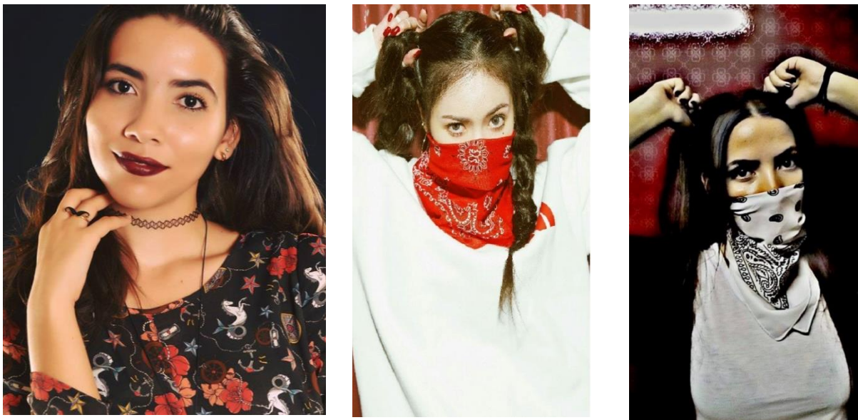
Imagem 11: Corpo Imaginário – a busca da imagem refletida . Cover Hyuna. Pós apresentação no evento Roiyaru.