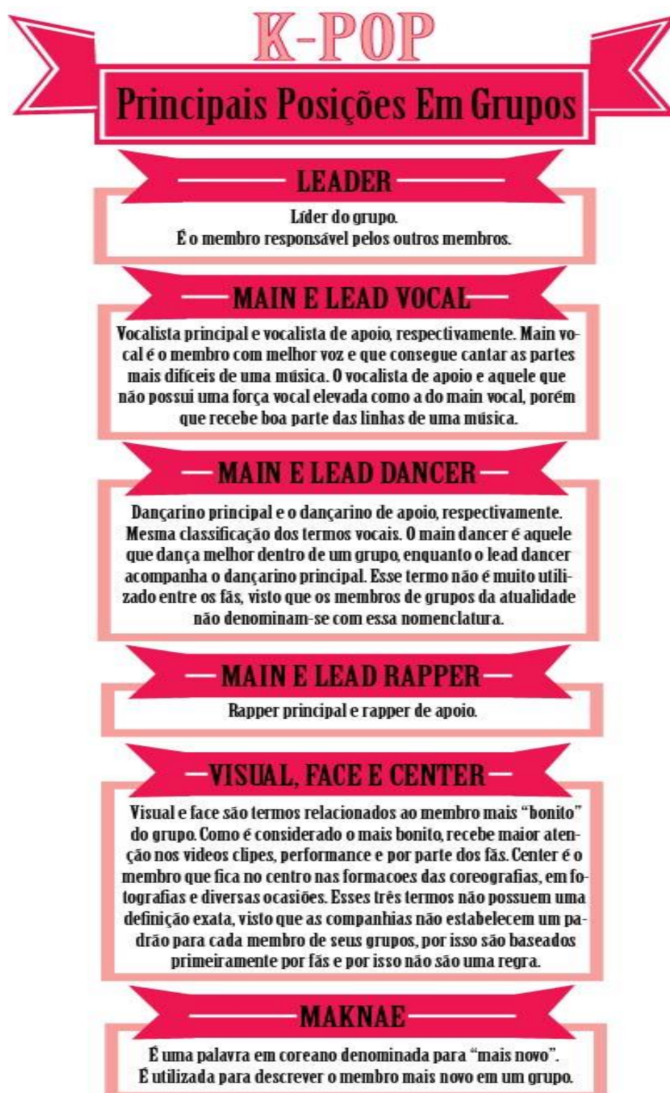
Quadro 3: posições utilizadas para denominar membros de grupos de K-Pop.