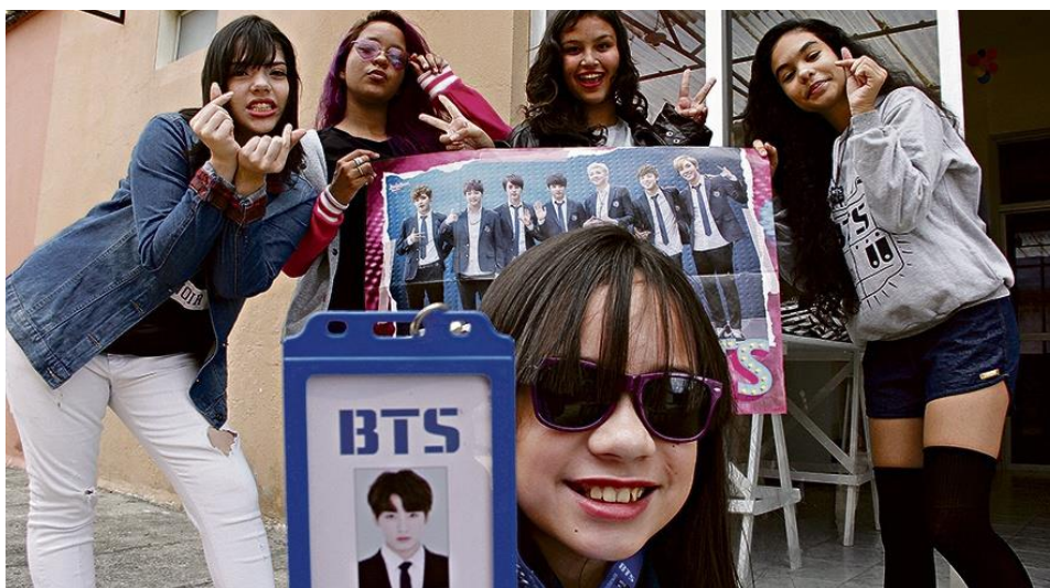
Imagem 16: Fãs de K-Pop em Belém.

Na foto abaixo, com base no Corpo Simbólico de Lacan (1998), pode-se observar um grupo de meninas que adotaram características aos quais grande parte dos fãs de K-Pop adotam, como a vestimenta: casacos, mesmo que a condição climática não seja favorável para tal, meias \frac{3}{4} , o nome do seu idol group estampado na camisa/casaco, símbolos que representam coração com as mãos; um estilo mais excêntrico, que carregam consigo não só questões culturais exercidas sobre o corpo, como também objetos característicos que demarcam esse espaço cultural.