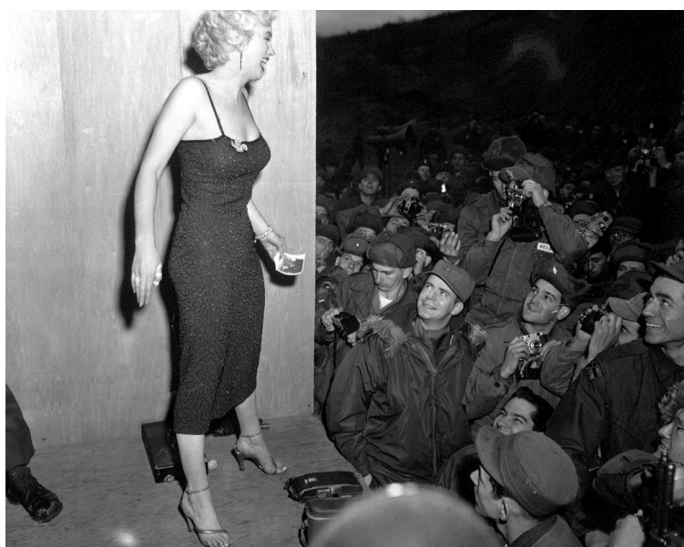
Imagem 3: Em 1954, Marilyn Monroe visita um clube com soldados no território da Coreia do Sul.

Tropas americanas foram para a Coreia do Sul e a cultura do ocidente foi cada vez mais introduzida no país. Com isso, clubes para os guerrilheiros americanos, foram criados e tornaram-se muito populares na época, devido as apresentações artísticas e de outros diversos elementos culturais americanos. Como pode-se observar na imagem a artista americana, Marilyn Monroe em visita nos clubes feitos para os soldados na Coreia do Sul.