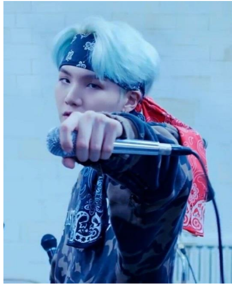
Imagem 13: Imagem 14: Yoon-gi (Suga) em MicDrop.