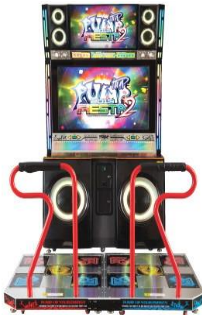
Imagem 1: Pump It Up.