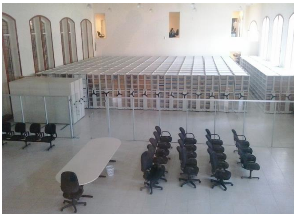
Figura 7: Área onde está localizado o acervo

O acervo do Centro de Memória da Amazônia fica em um espaço amplo, localizado no térreo do prédio. O acervo (Imagem 7) está dividido em duas seções, nas quais se encontra a massa documental de origem cível e criminal, de modo geral; e a seção de obras raras, onde estão os itens documentais raros que o CMA custodia como o Inventário do Intendente Antônio Lemos, as Cartas do Imperador D. Pedro II ao Barão de Cotegipe, entre outros, porém também a custodia a documentação que está sendo analisada neste trabalho, o processo criminal sobre o caso Severa Romana.