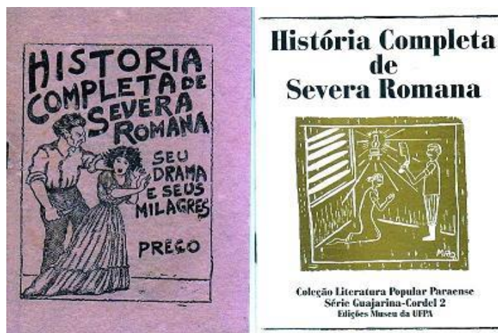
Figura 4: Na imagem do lado esquerdo, cordel que circulava na década de 40 e a direita a Edição da EDUFPA.

Mediante a devoção e as inúmeras graças alcançadas, fizeram com que a sua história se tornasse mais conhecida e sua imagem de santa popular se firmasse no imaginário Paraense. Toda essa popularidade pôde ser retratada em diversos meios artísticos como na literatura, teatro, cinema e música. Um exemplo da proporção que a história de Severa ganhou, diz respeito a literatura de cordel intitulado “História completa de Severa Romana” (Imagem 4) que circulava na década de 40 na cidade de Belém e que segundo afirma Fernando Jares em seu Blog ‘Pelas ruas de Belém’, esse mesmo cordel “foi reeditado pela EDUFPA para o Museu da UFPA, também sem data, mas com introdução de Vicente Sales e com atualização linguística.”.