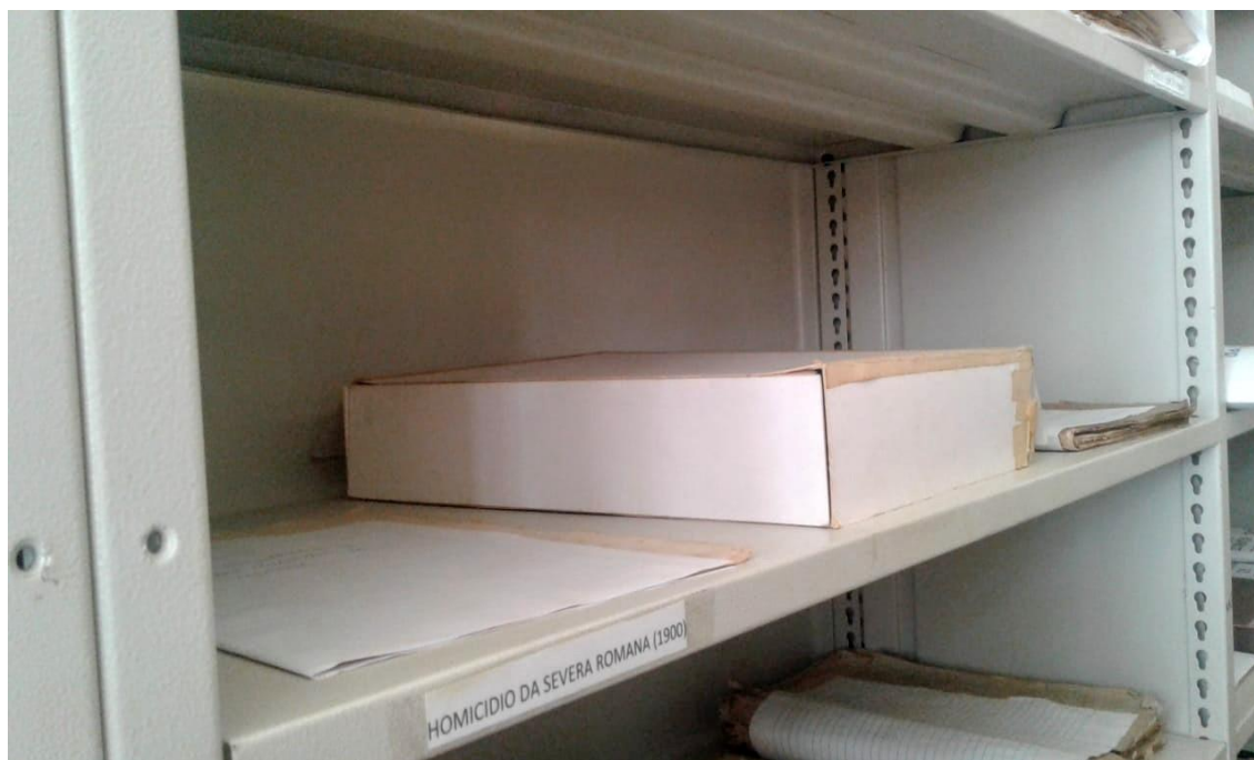
Figura 9: Prateleira em que está acondicionado o processo de Severa Romana.