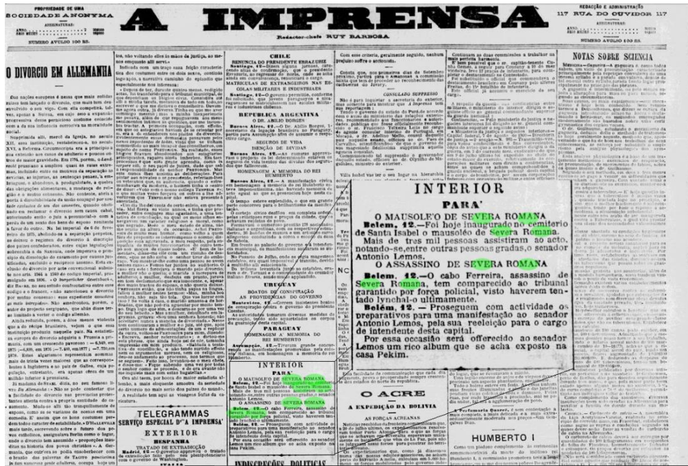
Figura 2: Jornal A Imprensa, do Rio de Janeiro, de 12 de agosto de 1900.