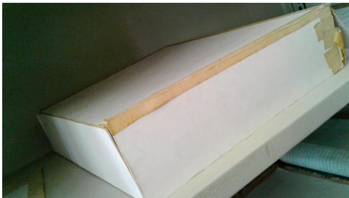
Figura 10: Invólucro onde está localizado o processo criminal.