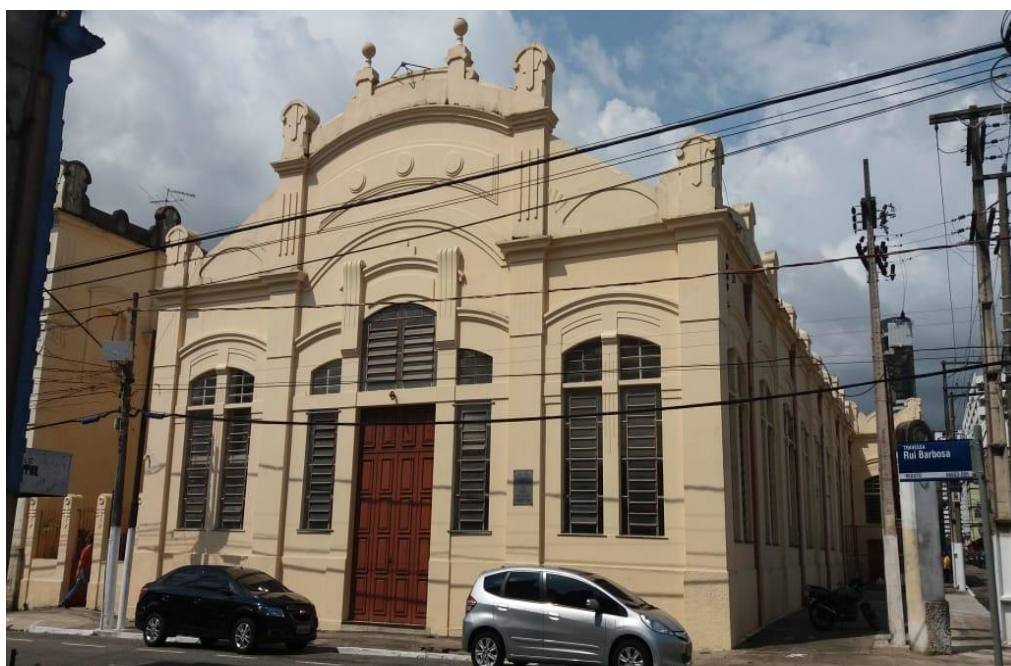
Figura 6: Centro de Memória da Amazônia (CMA)

O espaço abriga a biblioteca, sala de pesquisa climatizada, um auditório multifuncional, além de salas de exposição, de vídeo e de aula.