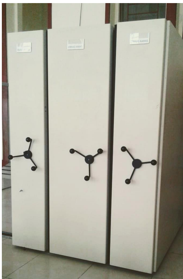
Figura 8: Arquivo deslizante da seção de obras raras.

Segundo os dados obtidos através do questionário, o processo Criminal de Severa é constituído por suporte de papel e tem como partes constituintes dados da investigação e laudos. O processo está acondicionado dentro de arquivo deslizante (Imagem 8), em prateleiras (Imagem 9), localizado na seção de obras raras. Está armazenado em uma caixa, dentro de um invólucro feito de papel e amarrado com um cadarço sarjado branco para garantir estabilidade à documentação. É importante ressaltar que o Arquivo deslizante é sempre mantido trancado, sem contato com iluminação externa ou qualquer outro tipo de iluminação.