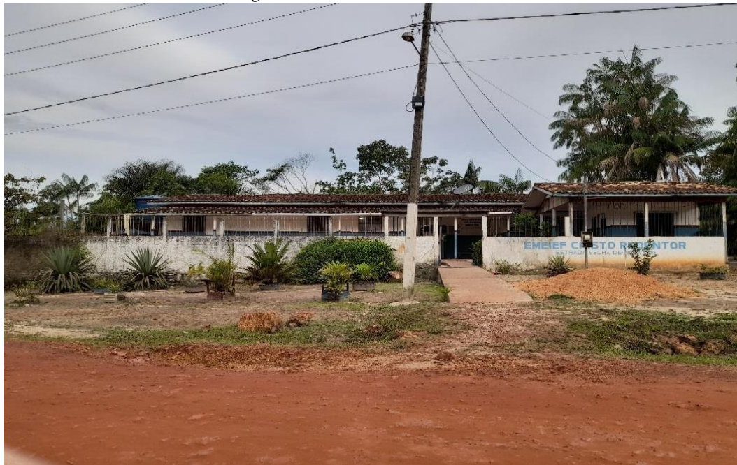
Figura 1 – Escola Cristo Redentor