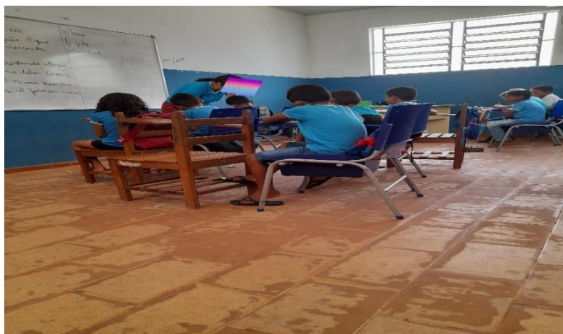
Pesquisa de campo, 2022