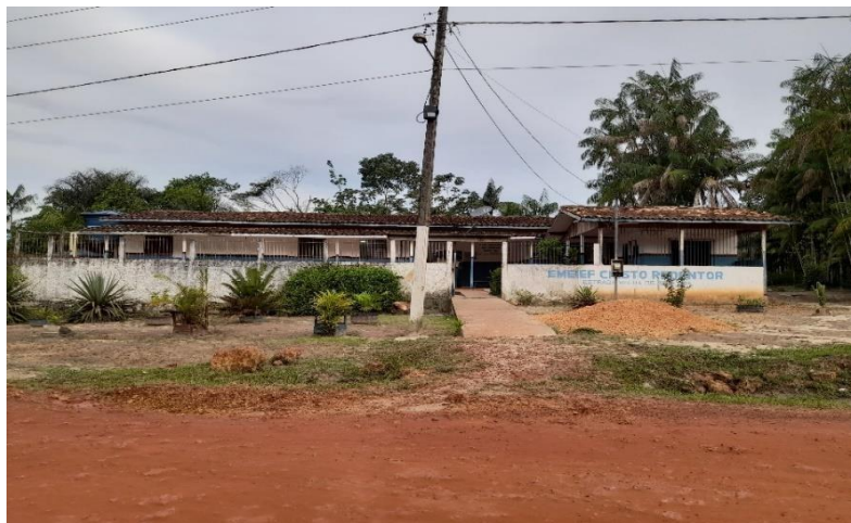
Pesquisa de campo, 2022.