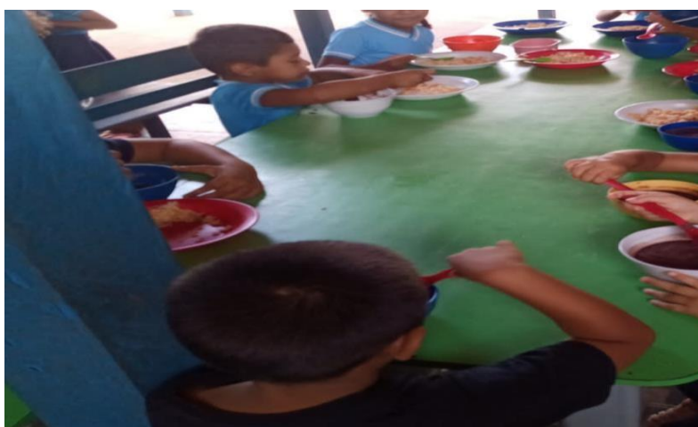
Pesquisa de campo, 2022.