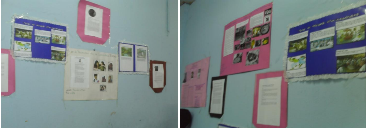
Fig. 2 – Imagem dos cartazes produzidos pelos alunos.

A culminância da atividade aconteceu no pátio da escola com a apresentação de músicas cantadas pelos alunos, capoeira e uma dança envolvendo alunas de todas as turmas em homenagem ao dia da consciência negra o que engrandeceu ainda mais o conhecimento sobre o povo africano (fig. 3)