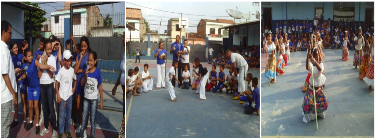
Fig. 3 – Fotos da apresentações dos alunos no pátio da escola em comemoração ao Dia da Consciência Negra

A culminância da atividade aconteceu no pátio da escola com a apresentação de músicas cantadas pelos alunos, capoeira e uma dança envolvendo alunas de todas as turmas em homenagem ao dia da consciência negra o que engrandeceu ainda mais o conhecimento sobre o povo africano (fig. 3)