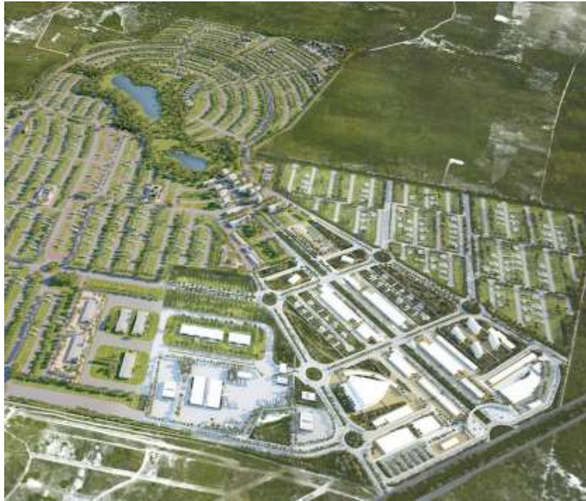
Figura 4 – Planejamento territorial da Cidade Laguna