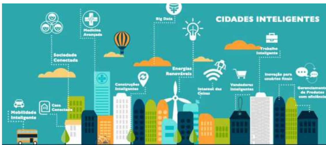
Figura 3 – O que faz de uma cidade ser inteligente

A plataforma também traz informações importantes para a população, como eventos sociais, notícias dos bairros, opções de entretenimento e alertas de segurança.