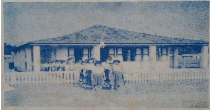
Figura 2 — Prédio do Internato Evangélico da Amazônia, onde ocorriam as aulas - 1948-1971.