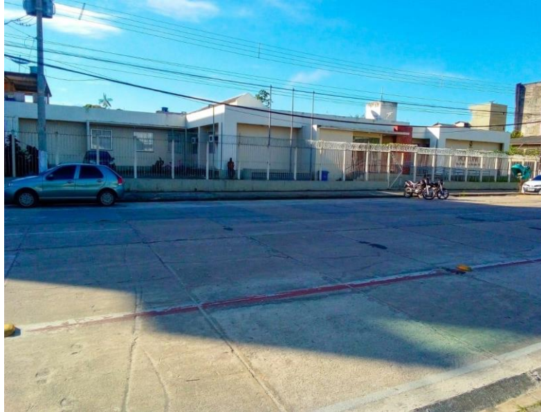
Figura 11: Fórum da Comarca de Breves, antigo Internato Evangélico Amazônico.