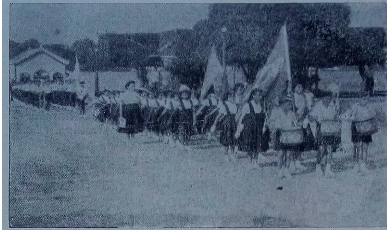
Figura 7— Desfile dos alunos do Internato/Externato no 7 de setembro de 1950?.