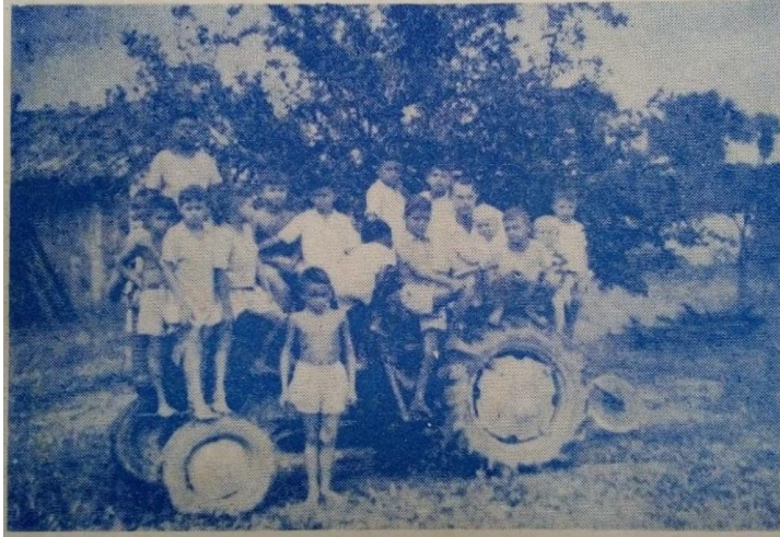
Figura 10: Crianças no trator doado ao Internato. Meados de 1949-1963.