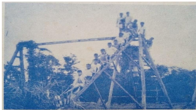
Figura 6 — Internos em momento de lazer. Meados de 1949-1963.