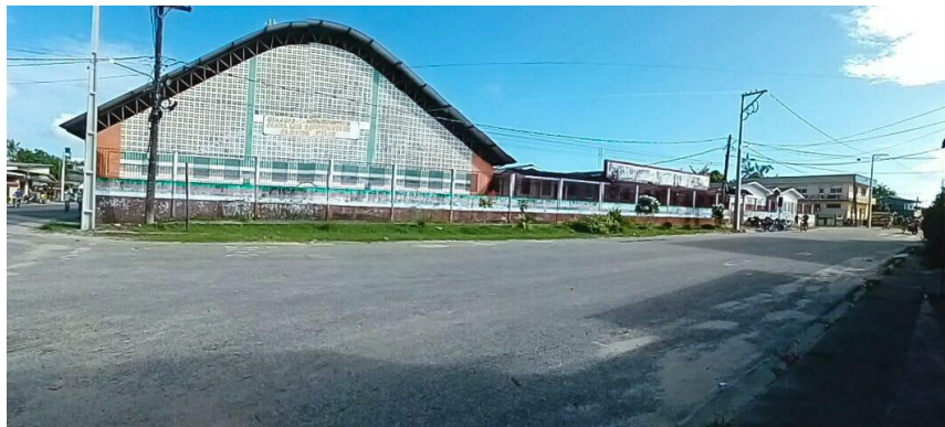
Figura 12: Escola Estevão Gomes, espaço ocupado antigamente por alojamentos de alunos do Internato Evangélico Amazônico.